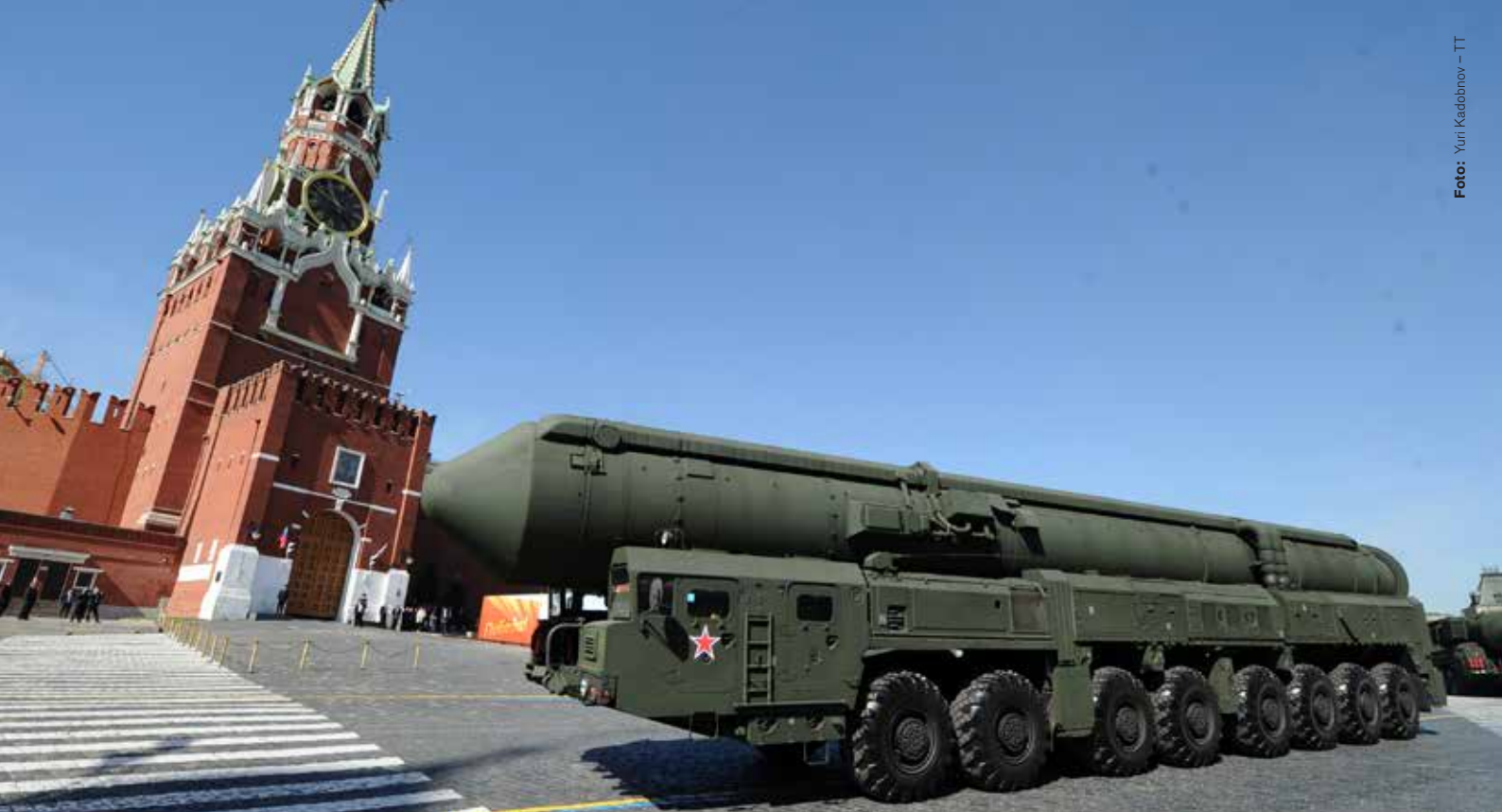
Rysk militär debatterar möjligheten att tvinga en motståndare att ge upp genom att nyttja ett fåtal taktiska kärnvapen.

Ryssland har ett antal förband och vapensystem anpassade för nukleära insatser på slagfältet. Raket- och artilleritrupporna har som en uttalad uppgift att bekämpa motståndaren med taktiska kärnvapen. De förfogar över flera artilleri- och markrobotsystem med taktiska kärnladdningar. Den ryska flottan har länge haft sjömålsrobotar och torpeder för att bekämpa hangarfartygsgrupper samt ett stort antal vapensystem för ubåtsjakt med kärnstridsspetsar. Med den nya fartygsbaserade kryssningsroboten Kalibr ökar antalet långräckviddiga kärnvapenbärande markmålsrobotar påtagligt. Slutligen finns ett stort antal flygburna robotar och bomber med taktiska kärnstridsspetsar.