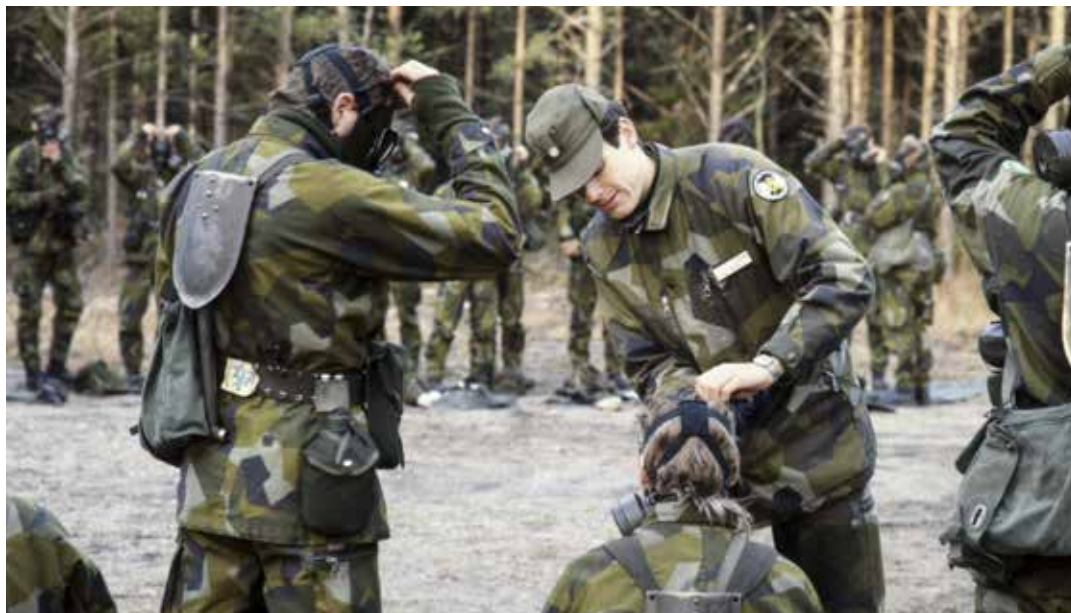
Befälen såg det som helt naturligt att kontrollera, rätta till och vid behov utöva ledarskap.

Alla hjälptes åt att städa alla utrymmen, inklusive fönsterputsning, den städmateriel som fanns i skåpet nyttjades med glädje och det utan att det fanns pärmar med kemikalieförteckningar. På fredagen fixades runt kasern så kaserngården såg vårdad ut. När det blev