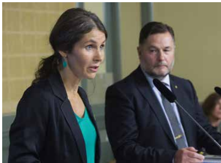
Ingångslönerna för soldater och sjömän måste höjas, enligt utredningen.

Försvarsmakten föreslås få tillgång till uppgifter rörande de som under mönstringen uppger sig vara intresserade av att göra rekryttjänstgöring. Något som inte är tillåtet idag.