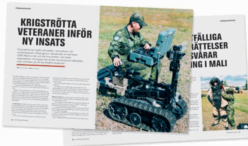
Arbetsituationen på Ing 2 uppmärksammades i förra numret av Officerstidningen.