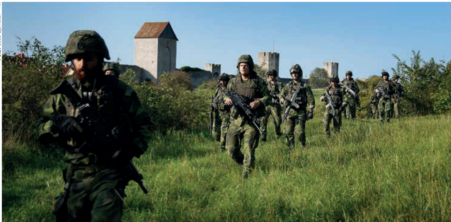
Bevakning av flygfält och hamnar samt skjutövningar på Tofta skjutfält har varit i fokus för kompaniet.