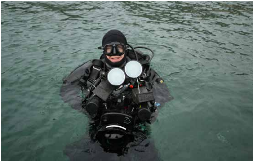
Sverige bäst i världen på dykning i kallt vatten.

”När jag inte fick på mig utrustningen lika snabbt som de mer erfarna gubbarna fick jag höra att ”Ska du hålla på hela jävla året?””