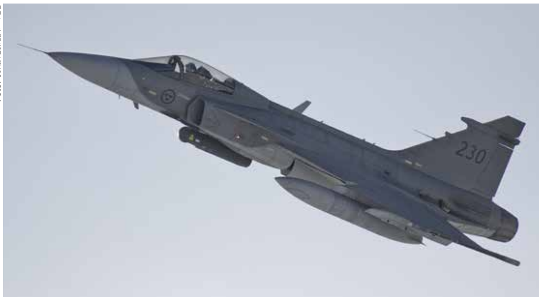
Wiktorins plan var att satsa på flygvapnet och JAS.