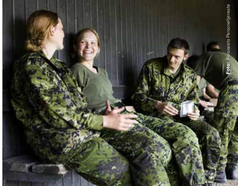
Unga danskor ser värnplikten som personlig utveckling.

VAD LIGGER BAKOM det ökade värnpliktsintresset från unga danska kvinnor?