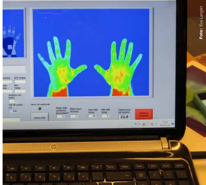
På datorskärmen kan man följa hur händerna tinar upp.

När fingrarna blir kalla är det svårt att känna strukturer eftersom känslan försämras och man blir fumligare. En enkel förebyggande metod är att linda en särskild isoleringstejp runt kontakt-ytorna, till exempel på pistoler.