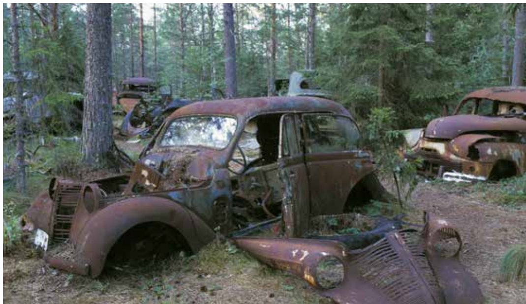
Fordon rostar i väntan på nytt förråd.

”Man kan köpa in materiel för en och en halv miljard, men inte anpassa förråd för hundratusen kronor”