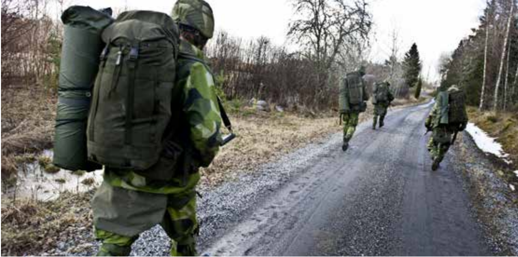
Arbetsbelastningen har tidigare varit för hög i början av GMU.