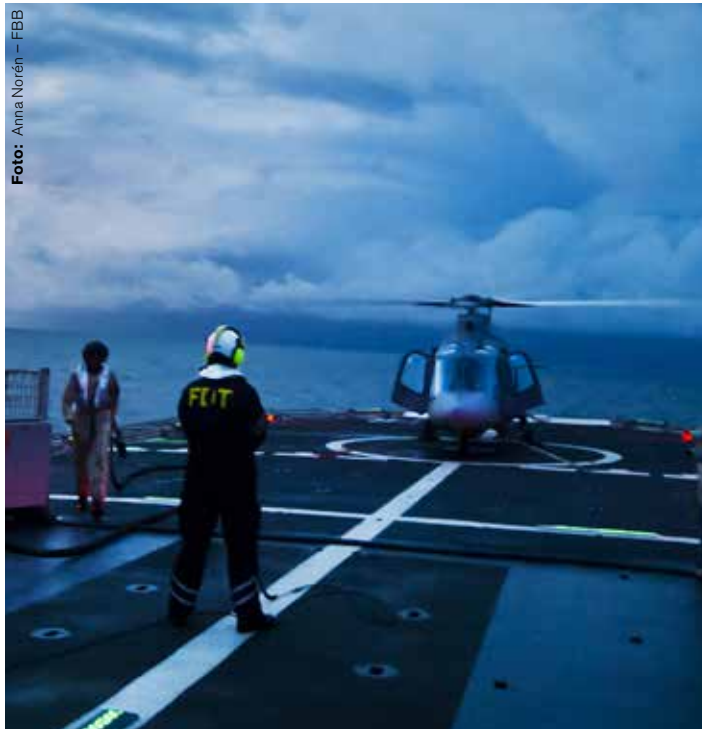
Stort behov av helikopterspaning längs Somalias kust.

– Att komplettera besättningen under pågående insats är inte optimalt, men det fungerade. På styrkehögkvarteret var man mycket imponerade av bilderna som svenskarna