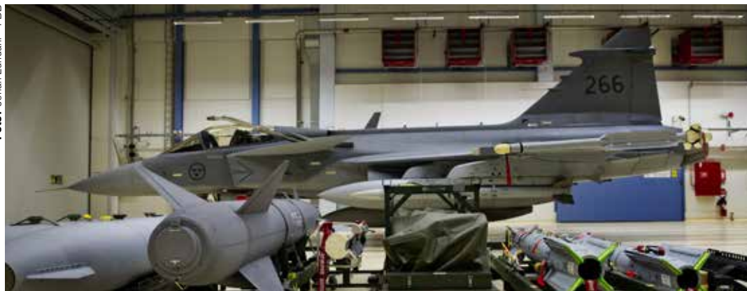
FMV har beslutat att verkstaden i Ronneby ska vara nedlagd i slutet av 2015.