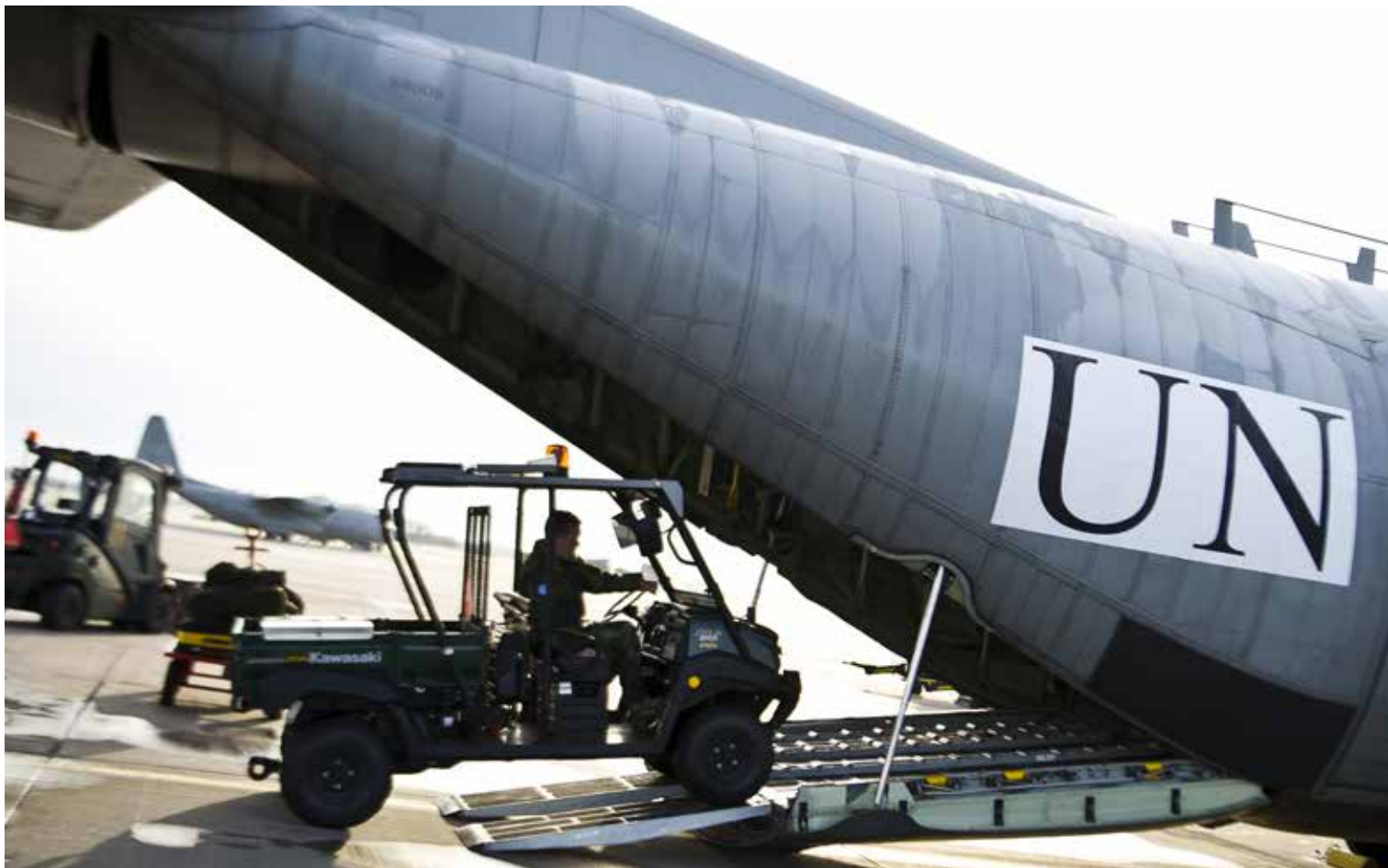
I årsredovisningen lyfter Försvarsmakten fram genomförda övningar och insatser under 2013.