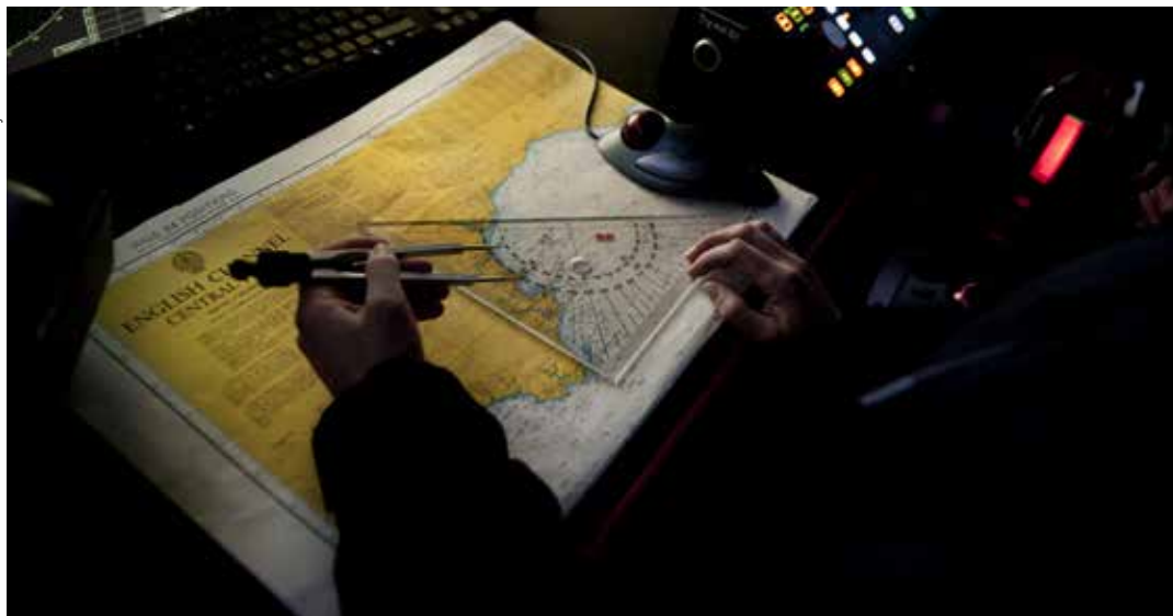
På grund av stela regler tappade Sjöstridsskolan en kadett med en civil examen värd en halv miljon kronor.

– Hade Försvarsmakten varit smart hade jag fått studieuppehåll.