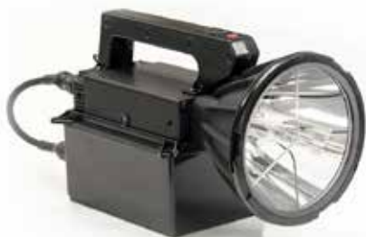
Watertight Enclosure system