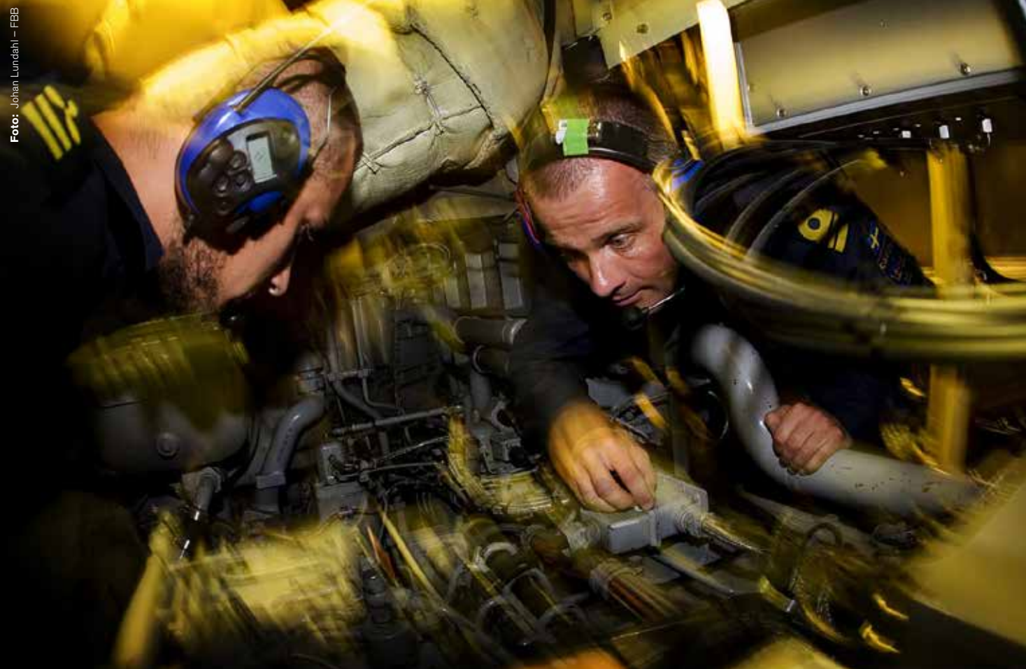
Med en omdanad försvarslogistik riskerar Försvarsmakten att hamna i knät på FMV.