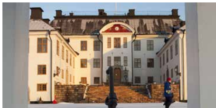
Förbundets kursutbud följer medlemmarnas efterfrågan.

Till del är din observation korrekt. Förbundets uppfattning just nu är dock att om vi skulle få samtliga chefer att följa gällande avtal, både till bokstav och and,