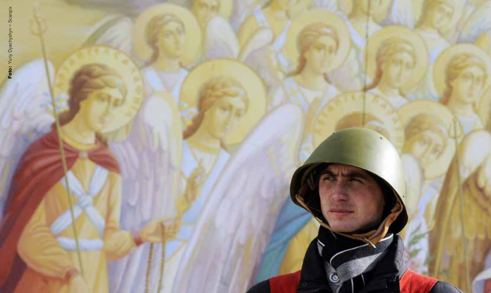
Den inrikespolitiska situationen i Ukraina är inte svart-vit.

Svaret lät inte vänta på sig. På Krimhalvön hissades den ryska flaggan i Sevastopol och tusentals demonstranter samlades i Simferopol där masslagsmål bröt ut mellan proryska och proukrainska demonstranter. Därefter ockuperades regerings- och parlamentsbyggnaden i Simferopol av väpnade proryska styrkor. Inspirerade av Majdan byggde de upp barrikader och satte upp skylten ”Krim är Ryssland”.