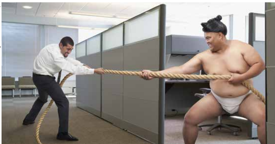
43 tvister är lösta, bland annat lyckades förbundet förhindra lönesänkningar för fyra medlemmar.