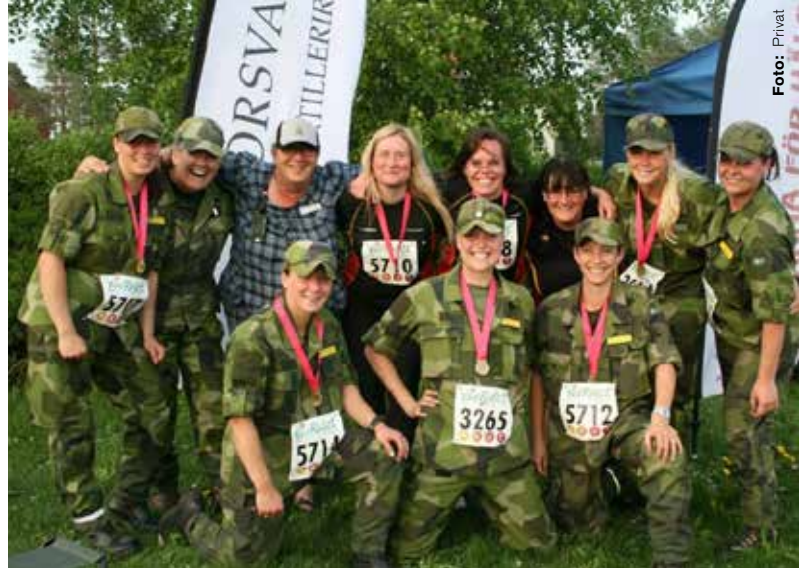
Regementet sponsrar även aktiviteter för de anställda kvinnorna. Våruset skapar sammanhållning, men bidrar även till rekryteringen av fler kvinnor

– I vintras fick vi många nya kvinnliga officerare och soldater. Det är ordersatt att de ska delta i vårt kommande planeringsinternat för att kunna ta ställning till om de vill vara med. Nyanställda från andra förband har ofta en negativ attityd, men har ofta sagt att 'det här är ju svinbra' efter att ha deltagit i introduktionen.