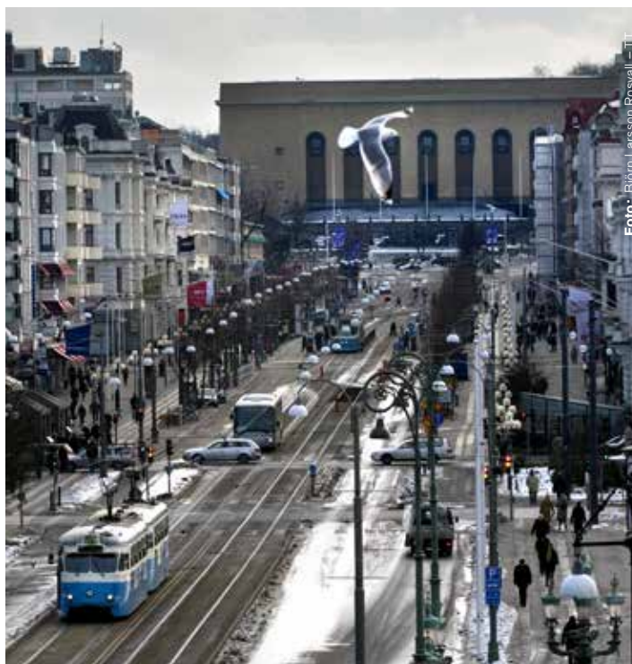
Det är inte allt som går som på räls i Göteborg.

har vi redan fått besked om att vi har anställning till slutet av 2015, säger han.