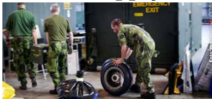
Libyeninsatsens snabba gruppering berodde snarare på lyckliga omständigheter än att försvaret kommit i hamn med omställningen.