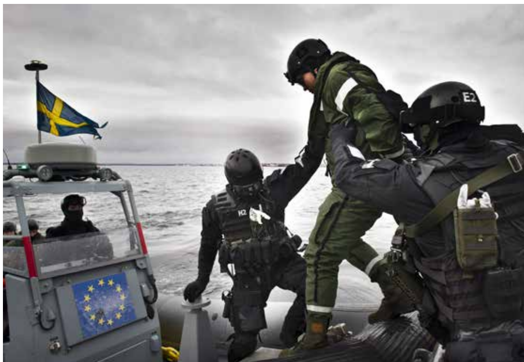
EU-samarbetets effekt på svensk försvarsförmåga förblir marginell, enligt utredningen.

”Vi kan knappast undgå att identifieras med alliansen – utan att få vare sig den effekt av samarbetet eller det solidariska skydd som ett medlemskap skulle innebära”