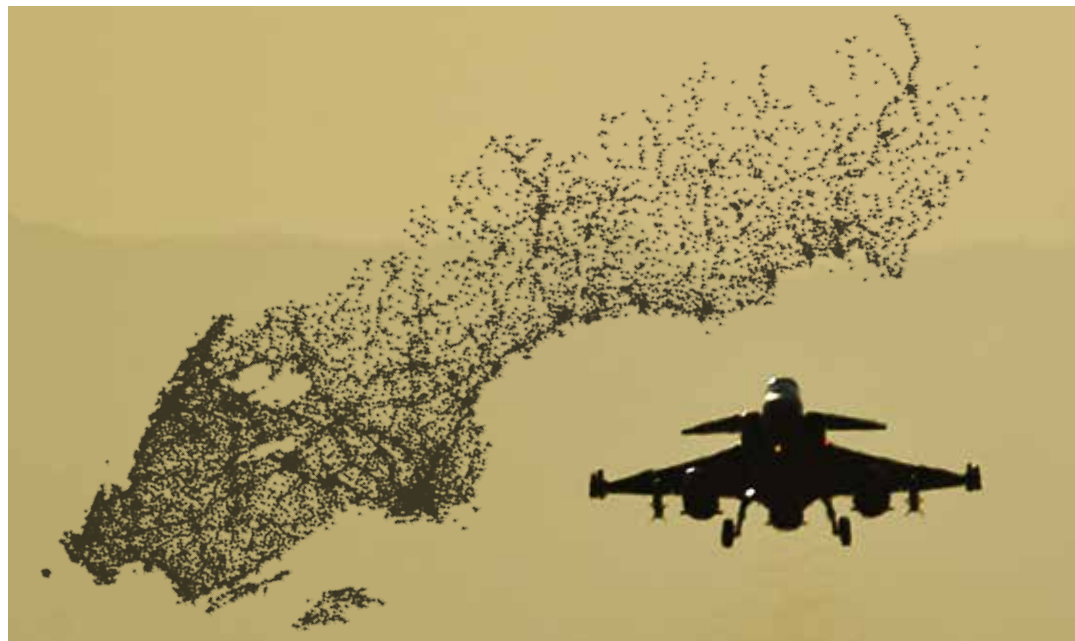
Kartan visar de flyghinder som upptäckts vid Luftfartsverkets kartläggning.

Hinderdatabasen förvaltas av Luftfartsverket (LFV) på uppdrag av Forsvarsmakten. Att piloten inte fått fram uppgifter om masten inför flygövningen berodde på att informationen inte fanns i Mil AIP utan på webbplatsen briefingrummet, vilket piloten inte kände till. Det kan i sin tur bero på att dåvarande luftfartssektionen på Högkvarteret använde en begränsad sändlista när förändringen genomfördes och kommunicerades ut 2008. Enligt beslutet skulle LFV informera prenumeranter av Mil AIP om förändringen, men vare sig Flyginspektionen eller flygoperatörens ledning fick vetskap om