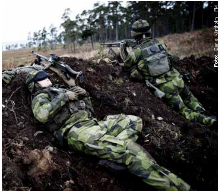
Kulspruteskyttar övar på Tofta inför utlandstjänst.