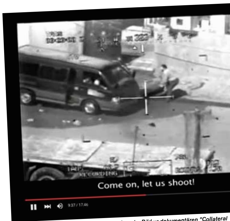
Militärens våldsanvändning har demokratiserats. Bild ur dokumentären "Collateral murder" som bygger på internt amerikanskt materiel som läckts till Wikileaks.

Vidare har diskussioner om vad som är ett rättfärdigt krig flyttat