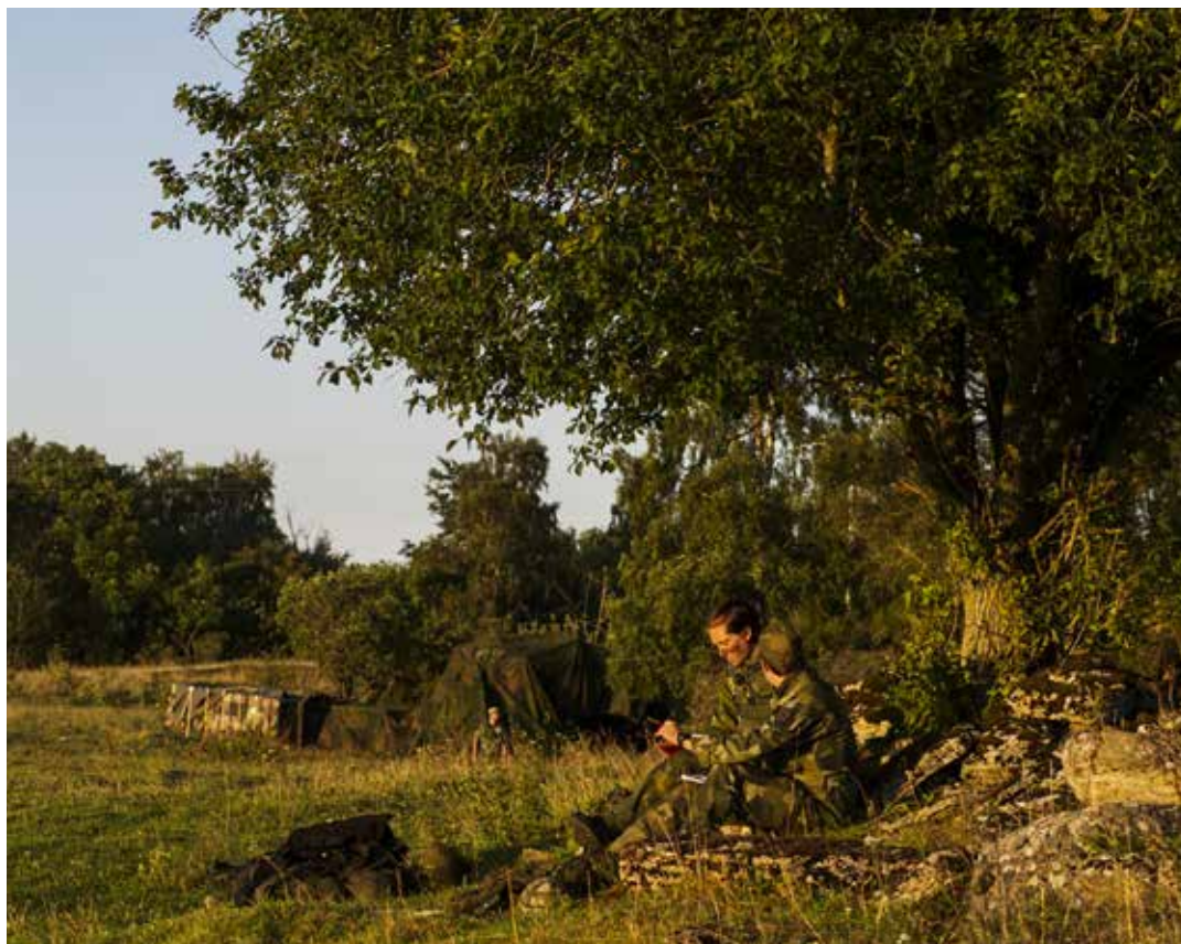
Försvarets skolor får fler fasta lärarbefattningar vilket kan leda till färre bemanningsuppdrag för förbanden.

I den nya organisationen förlorar K3 nästan en hel bataljon. Därmed kommer delar av den höga insatsberedskapen förbandet haft att