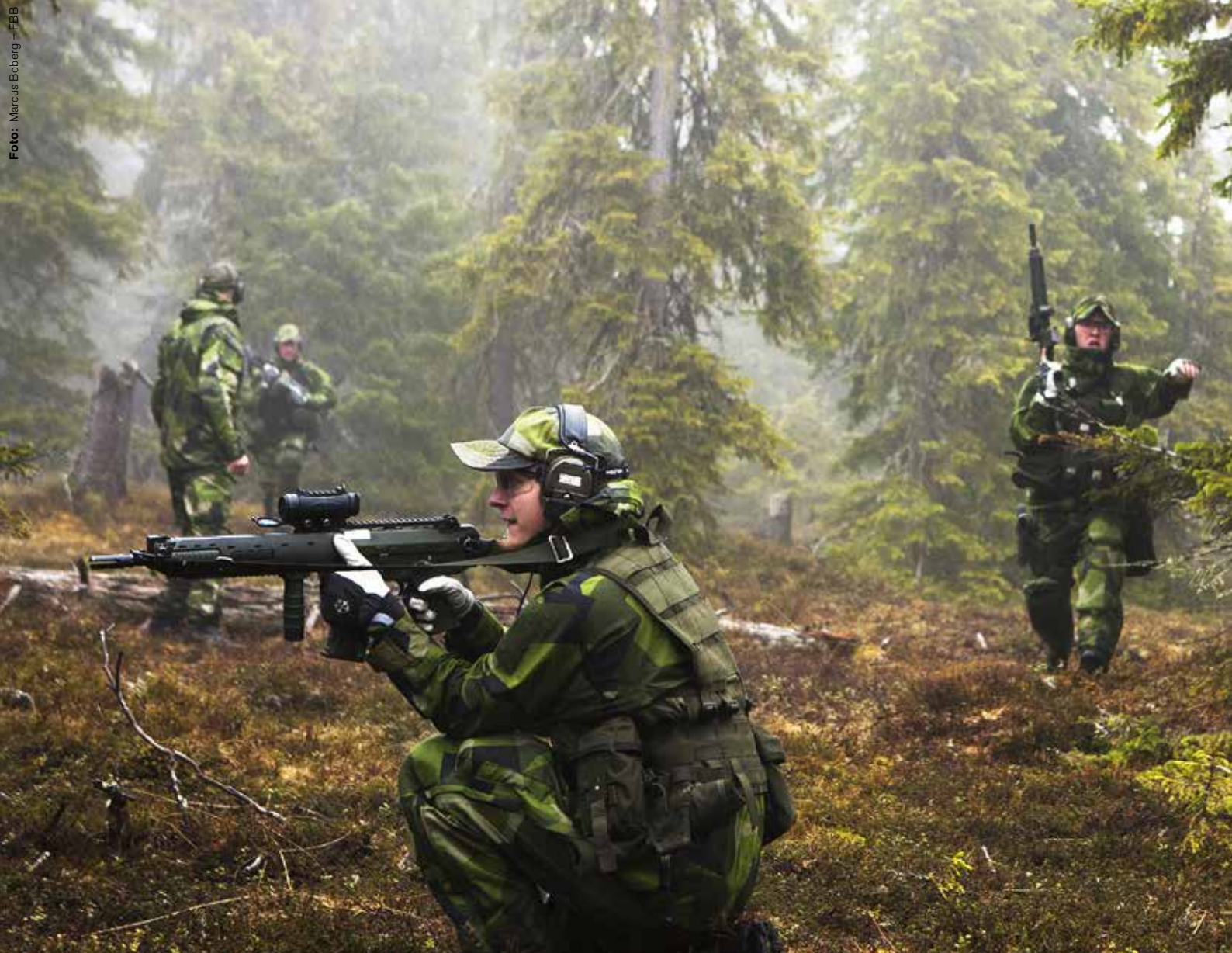
Arméns jägarbataljon övar korridorörförande. Enligt flera arméofficerare har korridor och blixtlås blivit dominerande metoder oavsett taktiskt läge, men