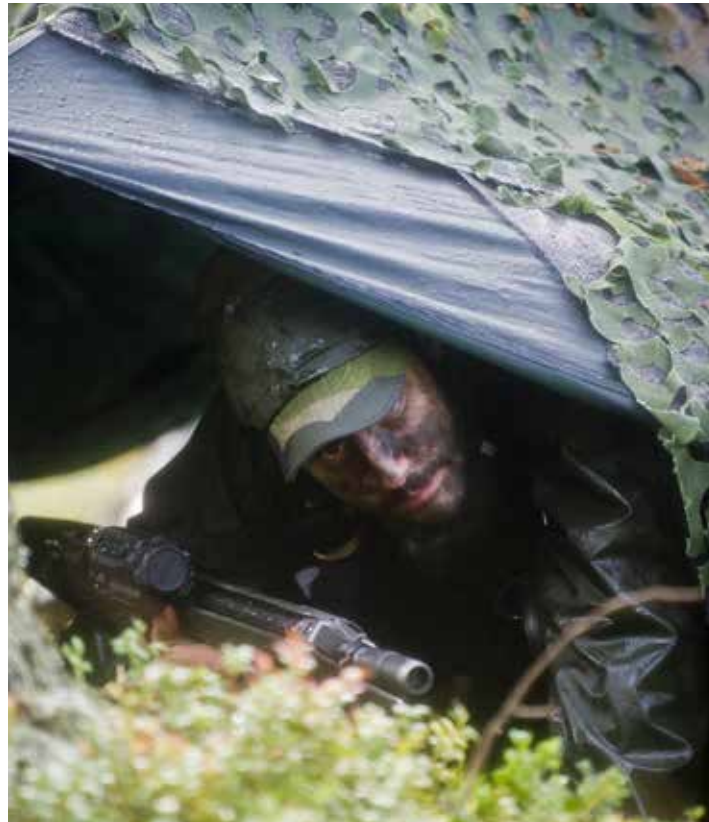
Förbandsövning är enligt ÖVA en övning i förband för att samträna stabs- och förbandsenheter i deras krigsuppgifter.

Du får erbjudandet och ansökningsblankett i brevlådan under november. Läs mer om sjukvårdsförsäkringen på www.lansforsakringar.se/sjukvard