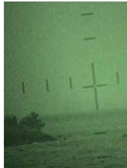
Försvårsmakten har ingen kritik att rikta mot operation i Stockholms skärgård.

Beslutet att berätta om operationen togs tidigt. Det var tre faktorer