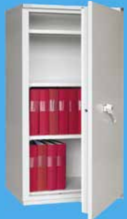
NT fire 017 Arkivskåp Dokumentskåp Vertikalskåp

Kontakta oss för mer information om denna möjlighet till att göra ännu bättre affärer!