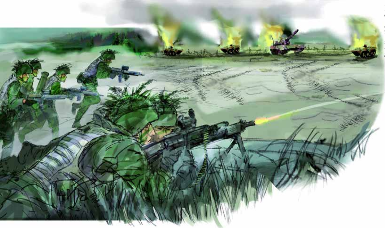
Illustration: Wolfgang Bartsch