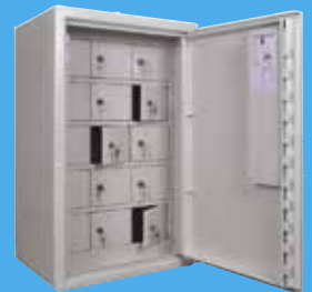
SS3492 Säkerhetsskåp Vapenskåp Nyckelskåp Laptopskåp

Nu har alla statliga myndigheter rätt att handla direkt ur hela vårt sortiment till bästa pris!