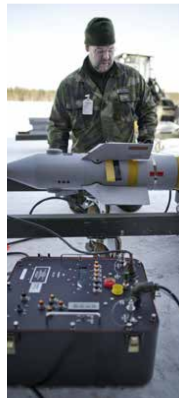
Berörda får ta ställning till växeltjänst.

Tackar man även nej till växeltjänstgöring vid FMV prövas individen mot andra eventuellt lediga befattningar i Försvarsmakten. Ytterst finns då en risk för övertalighet med uppsägning på grund av arbetsbrist som konsekvens. Trygghetsavtalet gäller dock inte om man i samband med en verksamhetsövergång motsatt sig att följa med till likvärdig anställning på samma ort man arbetar idag. Yrkesofficer med fullmaktsanställning kan dock i en sådan situation inte bli uppsagd.