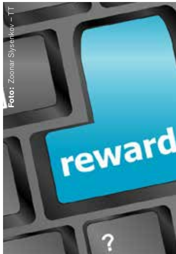
Ökad administration bidrog till Joas beslut att lämna försvaret.

– Processen var helt horribel. Jag hade erbjudanden från två andra förband som hade passat min karriär och min civila situation, men hemmaförbandet släppte mig inte. Jag tycker mig i flera fall, inte bara mitt eget, sett hur man tittar på sitt lilla förband och inte ser till myn-