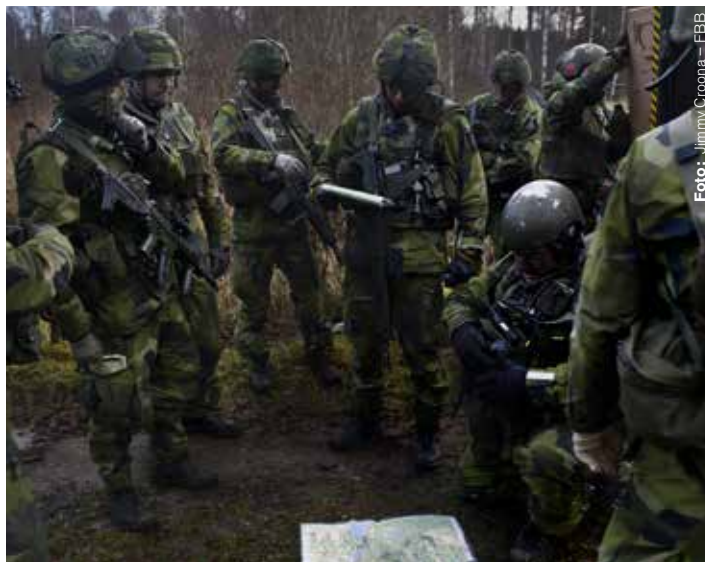
Hur ska gruppchefer med utökat ansvar lönesättas?

Deltagarna har frågat om de får någon höjd lön efter genomgången utbildning och fått beskedet att så inte är fallet.