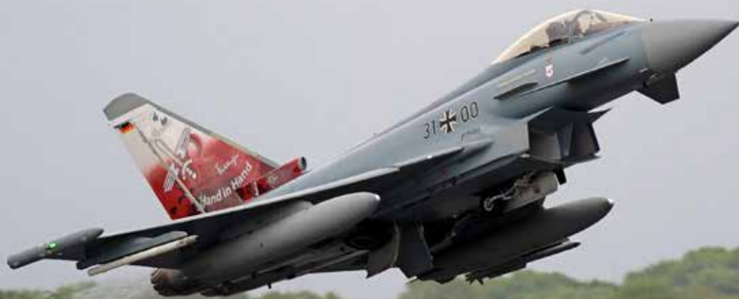
Av Tysklands 109 Eurofighters kan endast 42 starta.