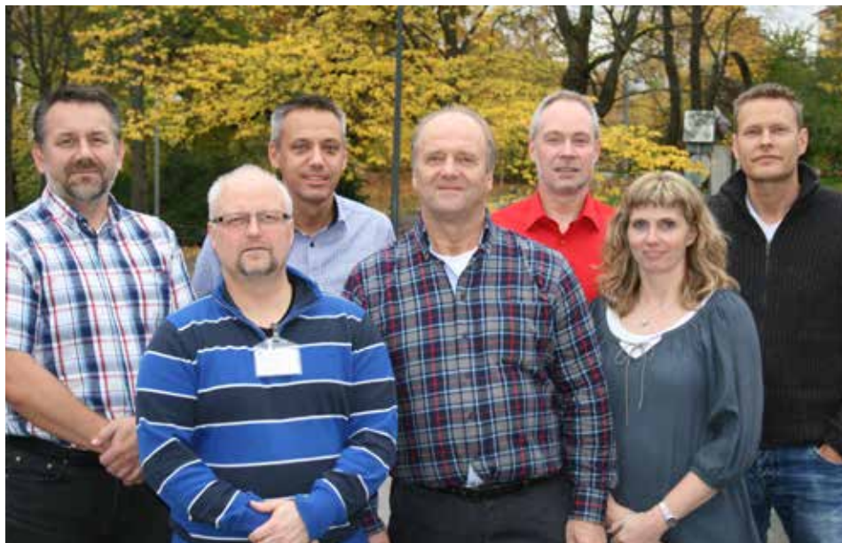
Valberedningen vill att så många medlemmar som möjligt ska kunna få sin identitet representerad.

Valberedningen tycker ändå att de landat i ett förslag till styrelse som kommer att kunna leda förbundet på ett förtroendefullt sätt under de närmaste åren. Officersföreningarna har aktivt tagit del i arbetet genom att nominera kandidater, svara på remisserna och nätverka med varandra för att hitta lösningar. Totalt har föreningarna nominerat 57 kandidater till posterna inom förbundsstyrelsen, ersättningskommittén, valberedningen och som revisorer. Valberedningen konstaterar att vissa förändringar tar tid