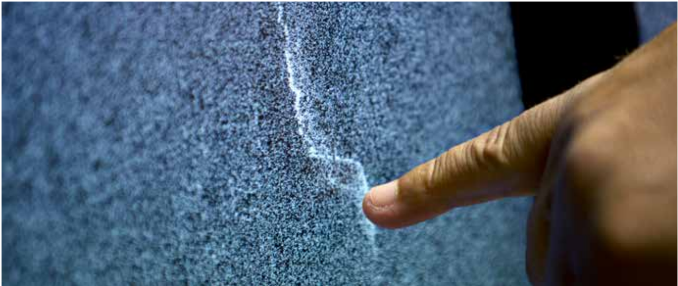
Ett fartyg ger utslag på lofargrammet. Frågan är vilket?