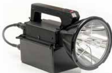
Waterlight Enclosure system