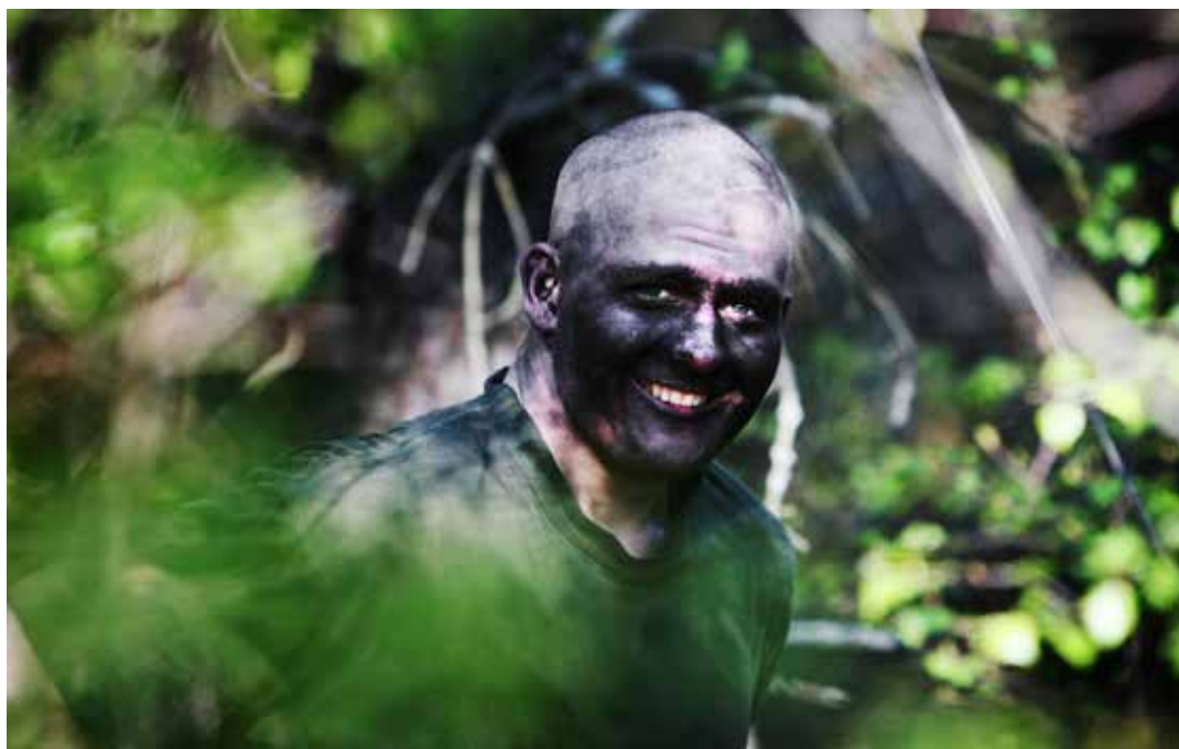
Försvarsmakten anser det av kritisk vikt att vända trenden med minskande förtroende.

”Sju av tio officerare kan inte rekommendera Försvarsmakten som arbetsgivare”