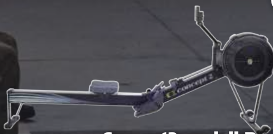
Concept2 modell D Roddmaskin med PM5-monitor Hyrpris: 395 kr/mån. *