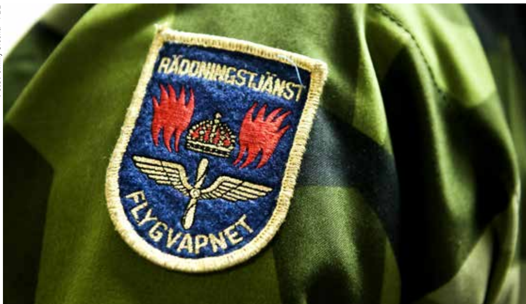
Räddningspersonal som kan ha kommit i kontakt med cancerogena ämnen som tidigare fanns i brandskum kan testas.