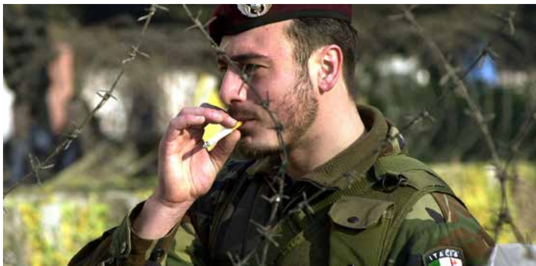
Det finns en stor skepsis i södra Europa mot att låta militärer organisera sig fackligt.

I de länder där organisationsförbud råder är argumenten ofta desamma, att det riskerar att leda till bristande disciplin, ordervägran