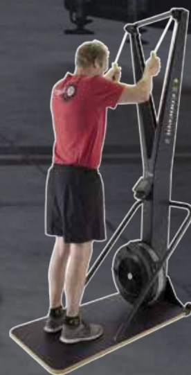
Nya Concept2 SkiErg Stakmaskin med PM5-monitor Hyrpris: 395 kr/mån. *