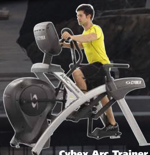
Cybex Arc Trainer Hyrpris: 1.249 kr/mån. *