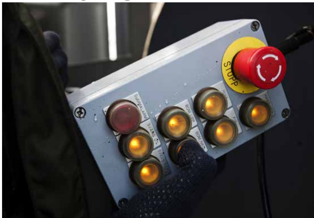
Enklare regler och ökat fokus på belastningsergonomi ska förhoppningsvis minska skadefrekvensen.