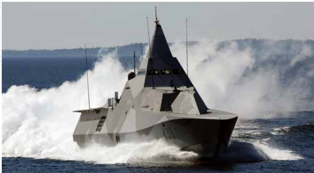
Att få öva med så många andra enheter är den främsta vinsten med deltagande i Northern coasts, enligt deltagare.

”Vi fick möta hot i alla dimensioner: på, över och under ytan”