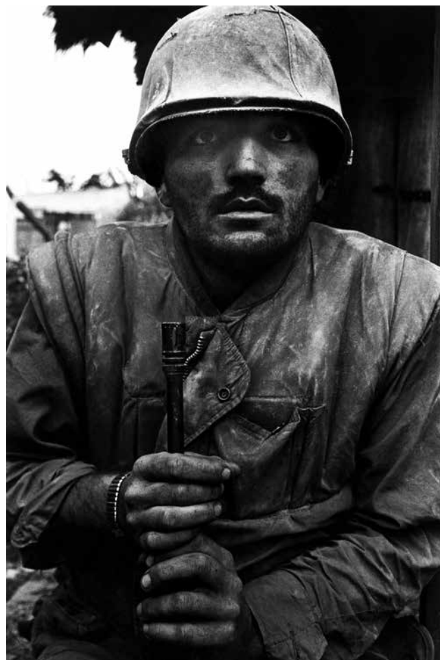
En amerikansk soldat i chock väntar på transport från fronten i Hue, Sydvietnam, 1968.

– Efter Balkan såg vi att det tog cirka tio år innan folk började dyka upp. Jag tror det beror på att de som åker på insats är starka individer som tycker att de ska klara av att hantera den här sortens stressframkallande händelser själva, men till slut brister det. Våra motsvarigheter i övriga Norden har samma erfarenheter.