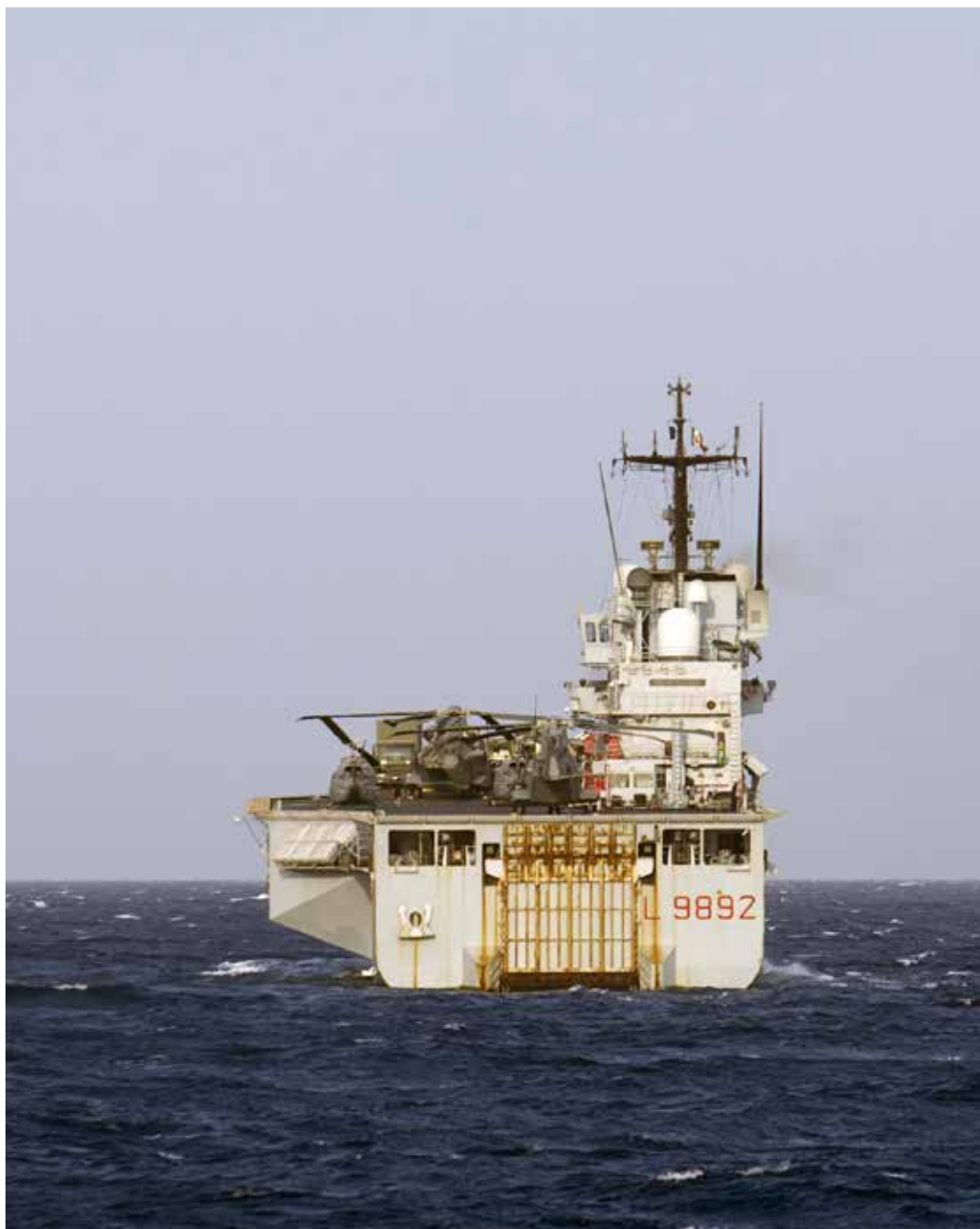
Utländsk militär är ingen långsiktig lösning på piratproblemen, hävdar forskare.