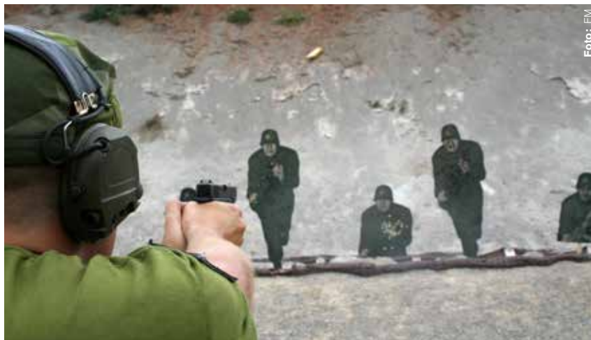
Bullerskador ökar bland officerare, GSS/K och rekryter.

Bullerskador ökar bland såväl officerare som GSS/K och rekryter. Störst är ökningen inom den sistnämnda gruppen där antalet fall fördubblades från 20 till 41. Av dem härrörde åtta anmälningar från ett och samma tillfälle då en pluton på Muskö gjort upp eld på en plats där ett nedgrävt magasin glömts kvar. Hettan från elden fick den lösa ammunitionen att brinna av och flera drabbades av bullertrauman.