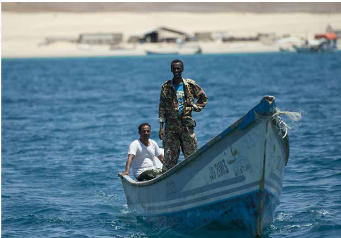
Det råder delade meningar om hur mycket kontakt ME04 haft med lokalbefolkningen under insatsen.