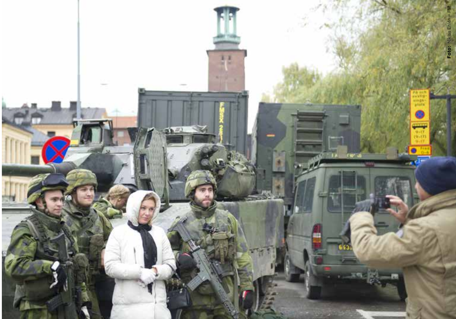
Många saknar tydliga uppfattningar om försvaret, enligt SOM-undersökningarna. Officerare hamnar under politiker och journalister i förtroendeligan.

och en högerorienterad befälskår, vari många var motståndare till allmän rösträtt och till parlamentarisk demokrati (England anfördes för övrigt som varnande exempel på det senare). Borggårdskrisen 1914 och dödsskjutningarna i Ådalen 1931 utgör milstolpar om man skall analysera framväxten av det svenska försvarets folkförankring.