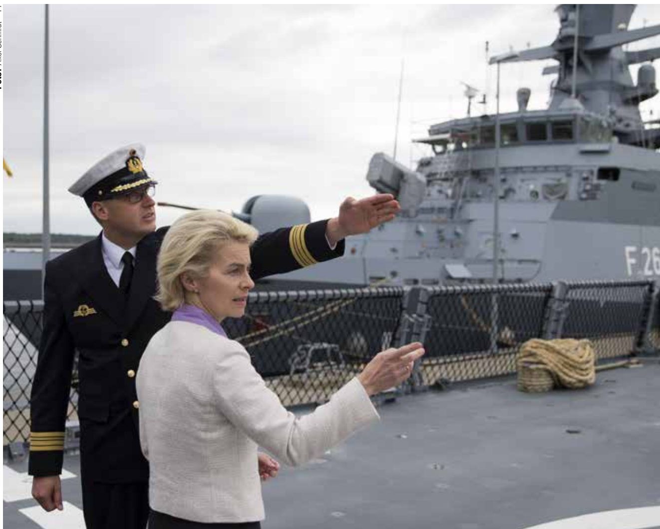
Tyska försvarsministern Ursula von der Leyen jobbar för en ökning av försvarsanslaget till 2016 med 4,2 procent.