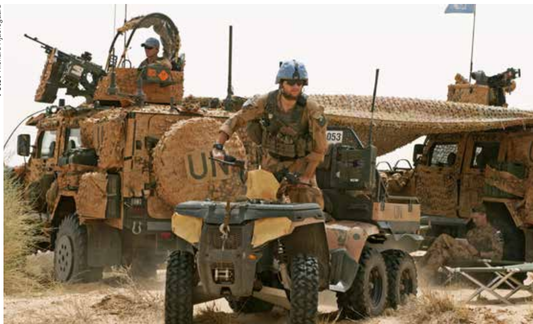
Den svenska Malistyrkan har precis avslutat en större operation väster om staden Timbuktu.