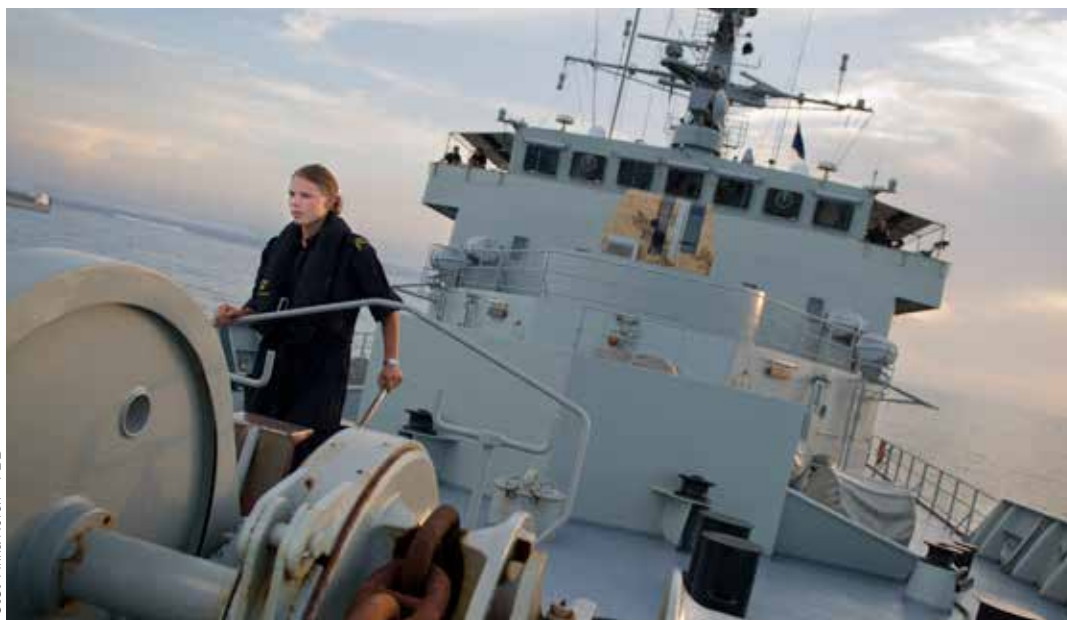
HMS Carlskrona har avslutat insatsen i Adenviken.