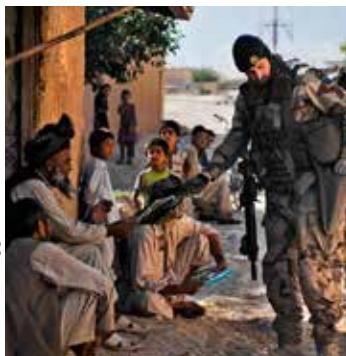
Svenska soldater på fotpatrull i grannskapet vid den svenska basen Camp Northern Light, vid Mazar-e-Sharif.