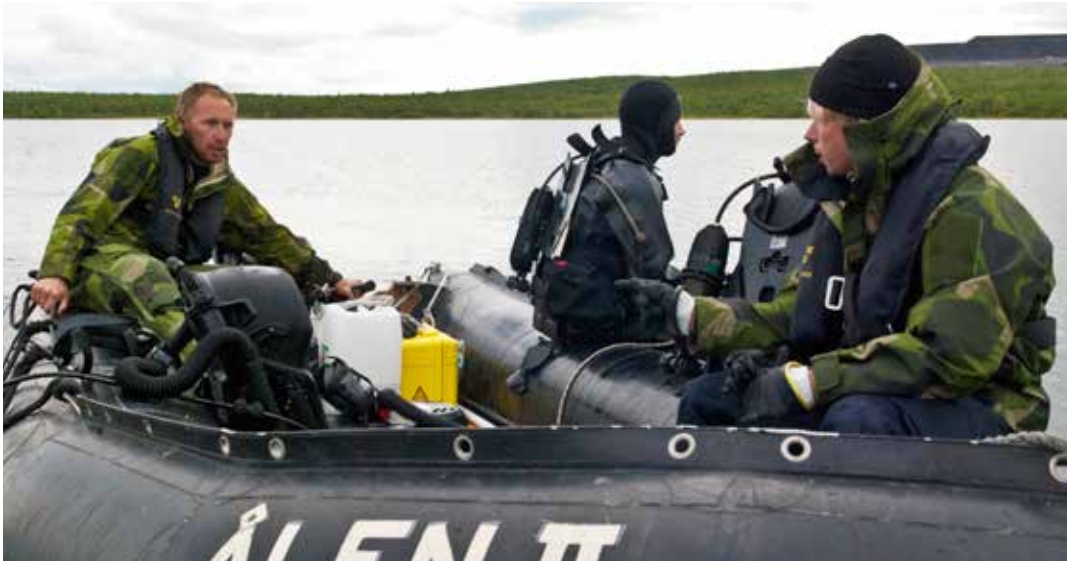
Röjdykare från Fjärde sjöstridsflottiljen rensar sjön från granater.