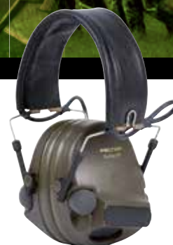
Peltor™ ComTac™ XP

För mer information, välkommen att kontakta vår Kundtjänst på telefon 0370-65 65 00. Referera till ramavtal FM-1211-10 vid beställning.