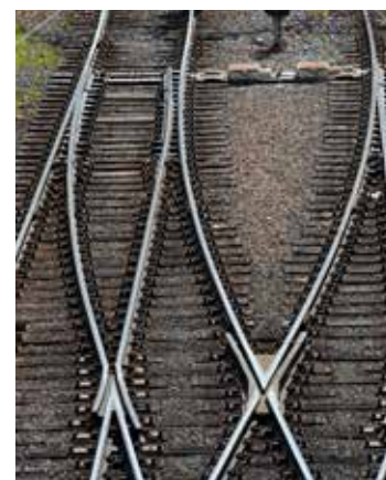
Växeltjänstgöring ett alternativ.

Under tiden fram till den 30 november kommer Försvarsmakten sedan hantera svaren på erbjuden växeltjänstgöring. De som då valt att tacka nej till växeltjänstgöring kommer prövas mot andra eventuella lediga befattningar i Försvarsmakten och i förekommande fall även att turordnas i enlighet med gällande turordningsregler. Ytterst finns då en risk för övertalighet