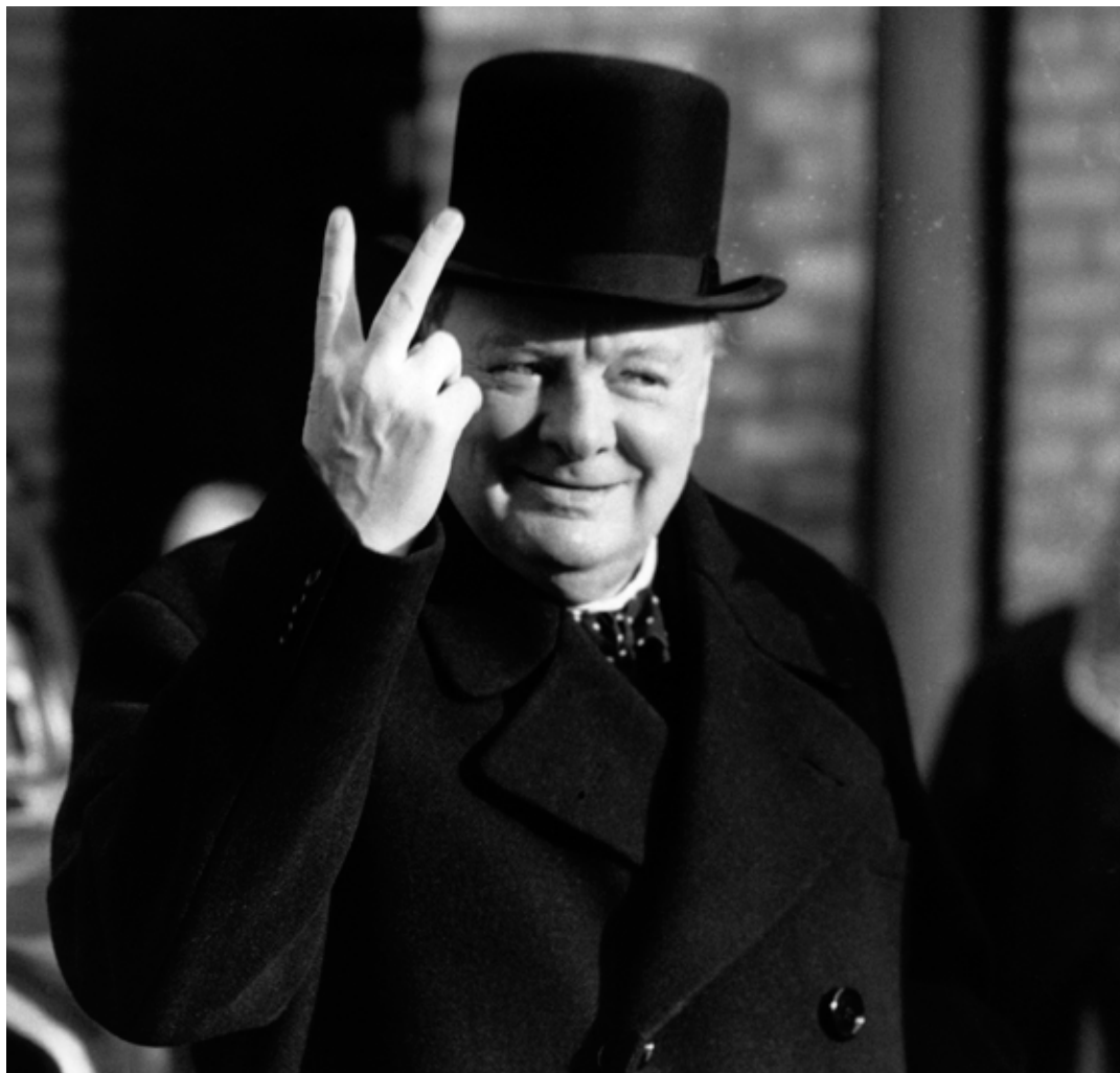
Insändarskribenten travesterar Churchill.

Ser man till antalet generaler inklusive brigadgeneraler/flottiljamiraler, överstar, överste-löjtnanter/