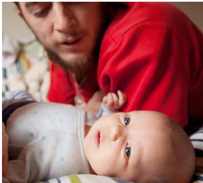
Föräldralön från september 2014.

Avtalet om föräldralön innebär i huvudsak inte heller någon förändring i ersättning. Den innebär en enklare administration än föräldralönstillägget eftersom det i framtiden inte behövs något intyg från Försäkringskassan om att föräldrapenning tas ut. Föräldralönen betalas upp till 360 dagar per barnbörd under de perioder du är föräldraledig. Är båda föräldrarna