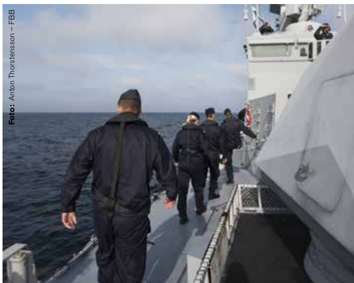
Sjömän och soldater ska slippa all Prio-administration.

Administratören ska ta över all Prio-administration som sjömän och soldater ägnar sig åt. Även första linjens chefer ska avlastas.