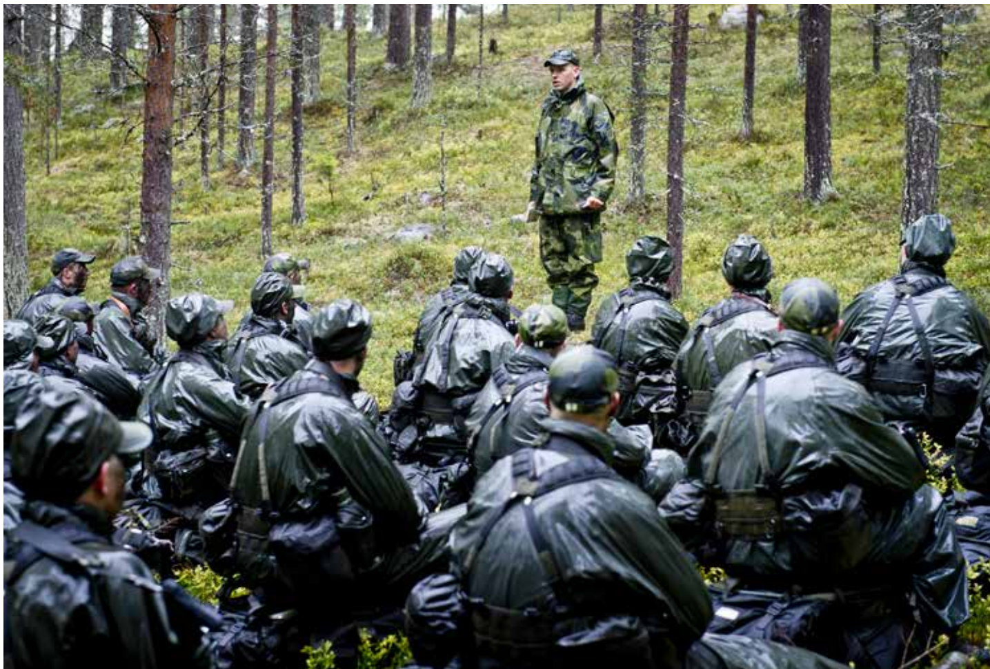
Officersprofessionen förbereder och genomför militära operationer.