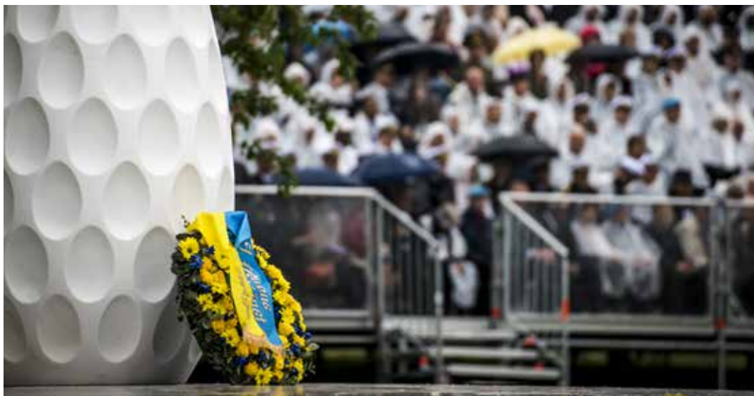
Veteranpolitiken är i stort sett implementerad.

”Sorgebarnet är stödet till de svårast skadade. Resurser har tillförts, men Försvarsmakten har inte lyckats optimera dem.”