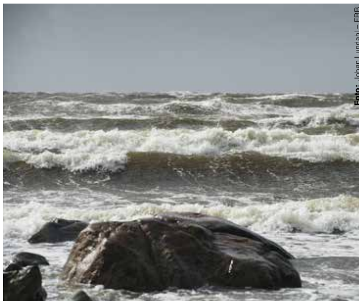
Mängder av stridsmedel har dumpats i Östersjön.

slutrapport, men redan nu har ett uppföljande projekt under namnet Modum startat. Med hjälp av undervattensfarkoster ska havsbotten scannas och sediment- och vattenprover analyseras direkt på fartyget. Utrustningen är finansierad av Natos forskningsfond för projekt som riskerar att utvecklas till allvarliga miljöhot.