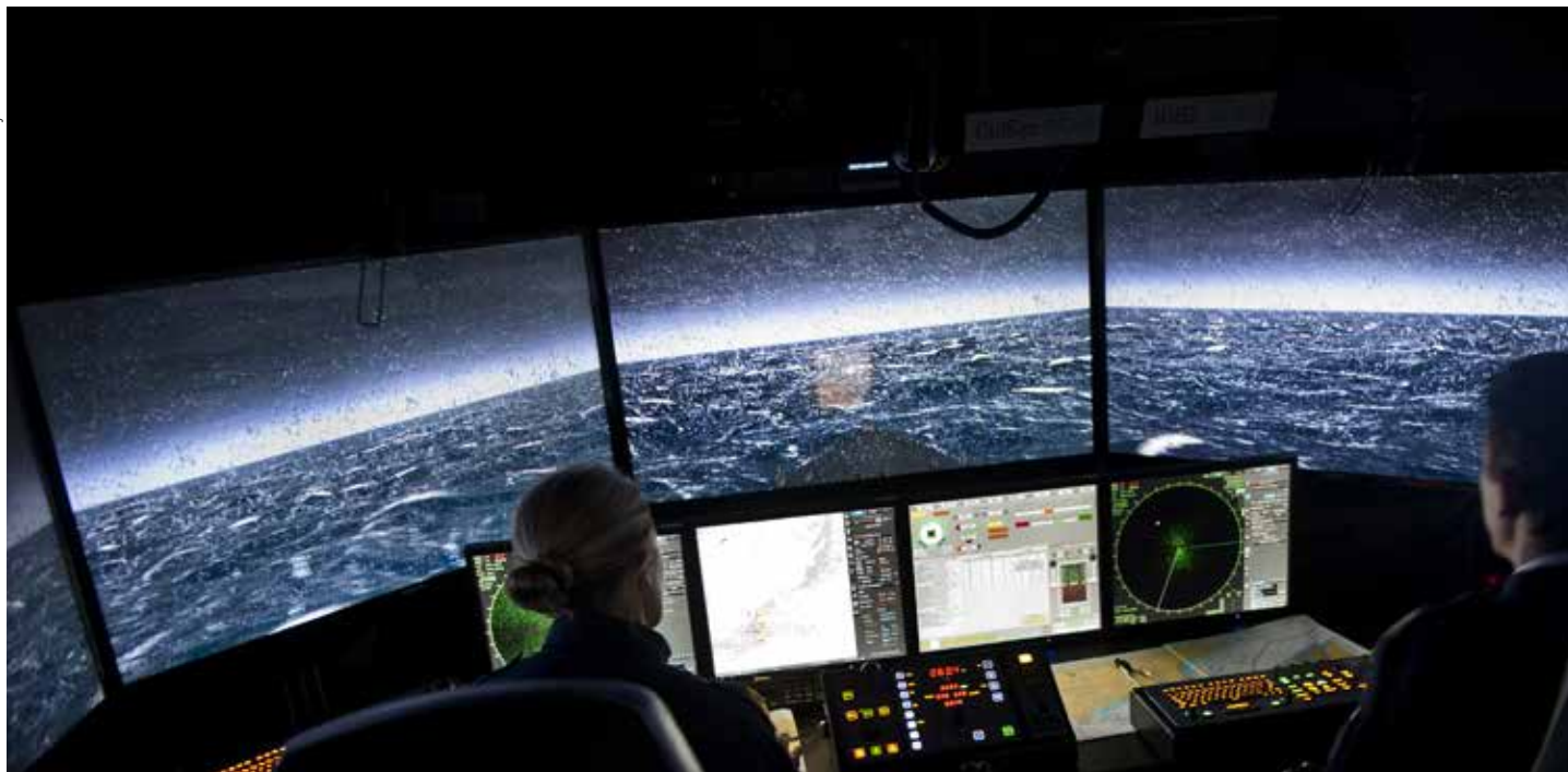
Simulatorer gör det möjligt att träna farliga moment.