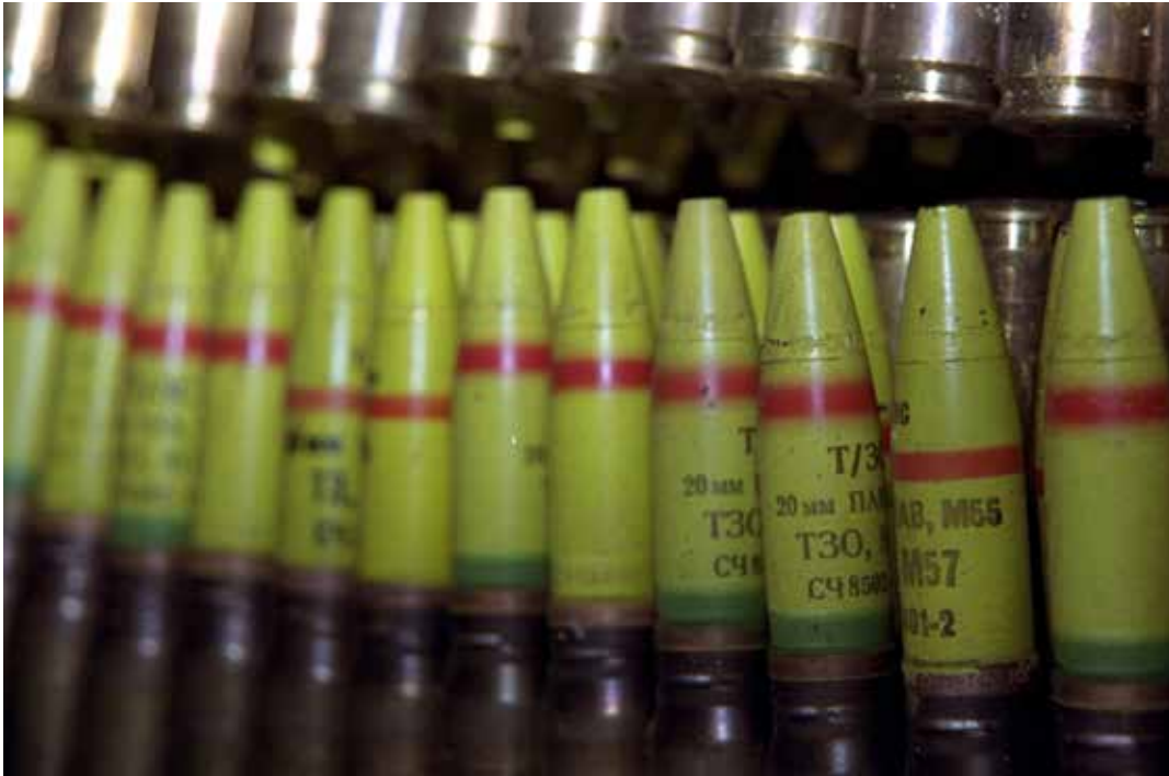
Vem som helst kan inte öppna ett ammunitionsförråd.

”Många chefer vittnar om att de inte vågar fatta beslut eftersom de inte vet vilken regel de i så fall eventuellt bryter mot.”