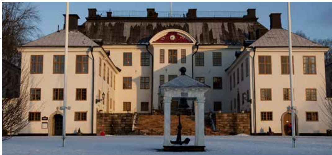
Officersförbundet delar inte försvarsberedningens syn på framtidens officersutbildning.