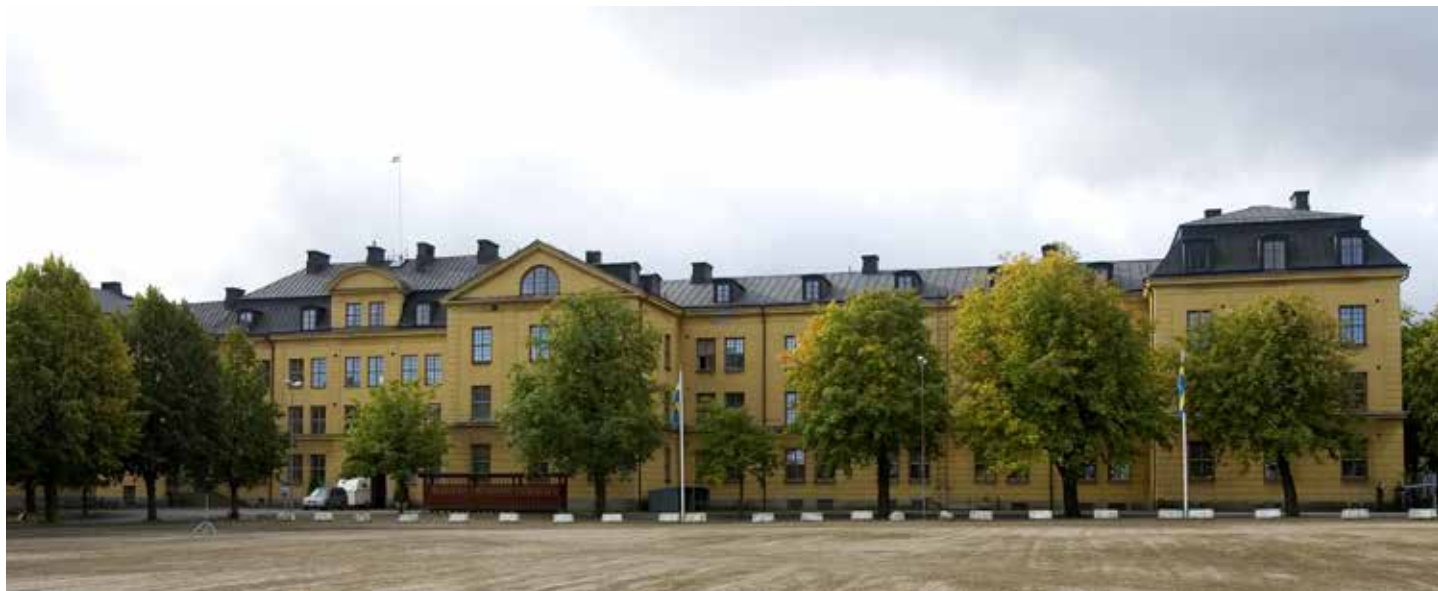
Spekulationer och oro angående lön bland Asou elever på Trängregementet.