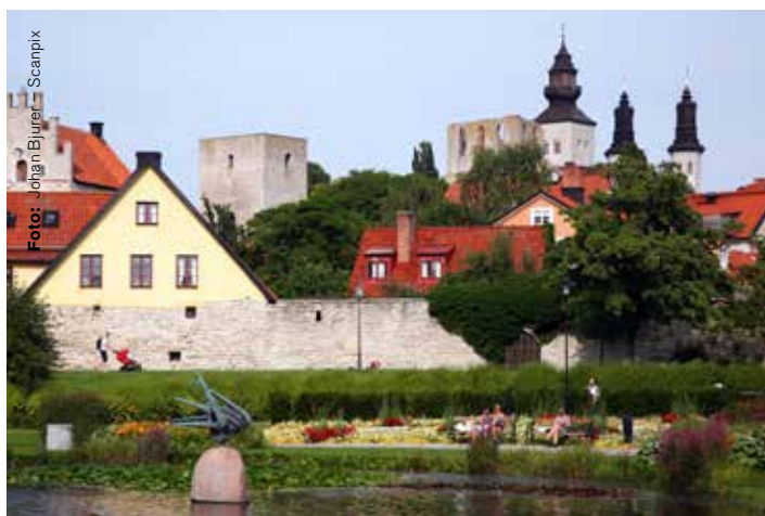
Besök Officersförbundet i korsningen Mellangatan-Trappgränd.

Tack vare er engagerade medlemmar har vi blivit närmare 100 fler i förbundet. Kampanjen Värva en kollega gav denna gång 96 nya medlemmar. Stort tack!