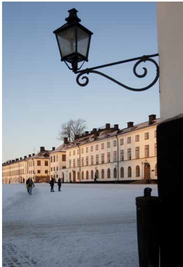
Fortfarande är värnpliktsbakgrund dominerande bland kadetterna på Karlberg.

Fortfarande har huvuddelen av de som rekryteras värnpliktsbakgrund, enligt FHS PM. Till OP 13–16 är det cirka 70 procent som