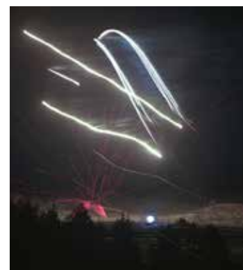
Spårbarhet borde vara enkelt.