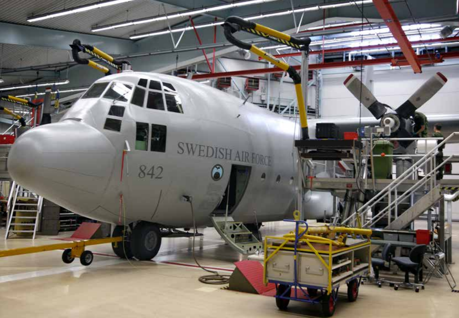
Den tekniska personalen varnar för övertro på inköp av nya flygplan. En uppgradering skulle kunna lösa mycket.