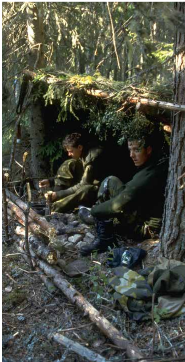
Tre Kronor borde hålla högre standard än fältbivack, menar skribenten.

Min fråga till de ansvariga är således om de vidhåller de tidigare uttalandena som jag relaterat ovan. Vidare om de som satsat 1000 kronor och förespeglats en lägenhet i centrala Stockholm eller Norra