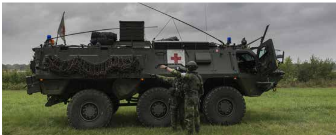
Den civila sjukvården ska ersätta fältsjukhusen i Försvarmaktens nya sjukvårdssystem.

– Det finns en fantastiskt stor brist på katastrofmedicin i samhället totalt sett, något politikerna blev varse i samband med katastrofen på Utöya. Vi har mycket hög kvalitet på vår sjukvård men låg kvantitativ för-