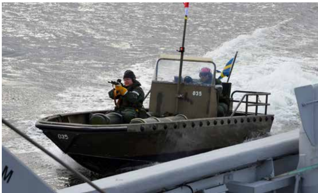
Den havererade G-båten bedrev navigering i mörker. (G-båten på bilden genomför ett annat övningsmoment.)