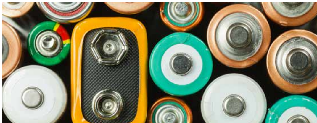
Förbrukningsmateriel såsom pennor och batterier ska nu kunna skaffas via snabbköp på förbanden, istället för via Prio.