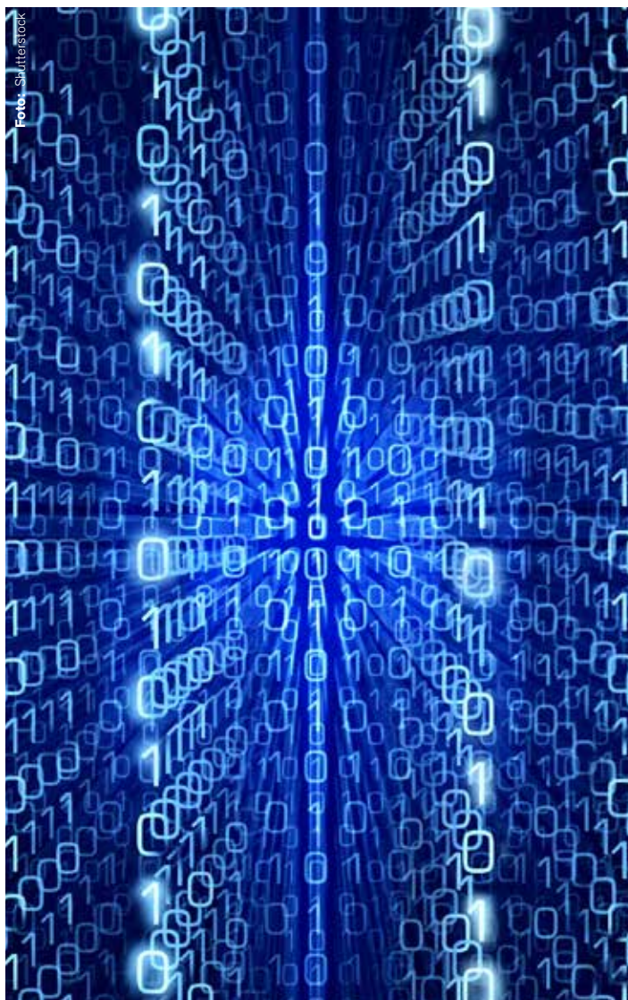
Ny internetlösning lanseras i höst, men fortfarande kvarstår kopplingen till helvetet – i alla fall i namnet. Enligt Dante var Acheron floden varöver färjkarlen Charon skeppade de döda.

– Mycket trafik i vår infrastruktur gör att det ibland kan uppstå pro-