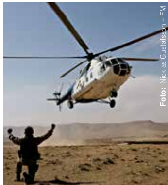
Se över ditt försäkringskydd innan insats.

Istället har Arbetsgivarverket beslutat att staten endast ska betala ut mellanskillnaden mellan det be-