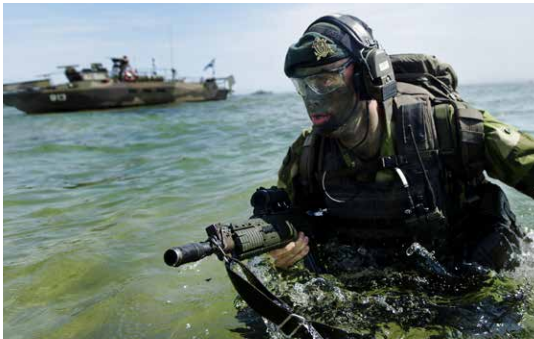
Många vill genomgå den nya, längre, militära grundutbildningen på Amfibieregementet, färre vill till beridna högvakten.