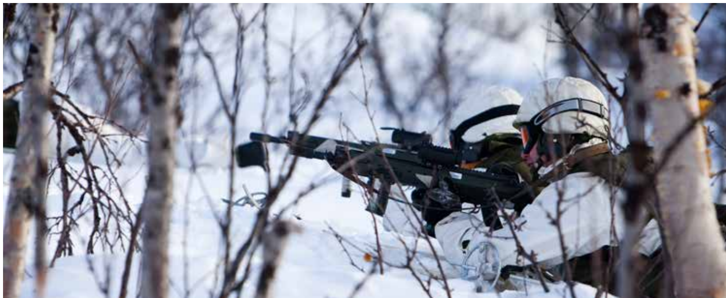
Tidigare värnpliktiga i Arvidsjaur kan ha fått följdverkningar av sin tid i kyla.