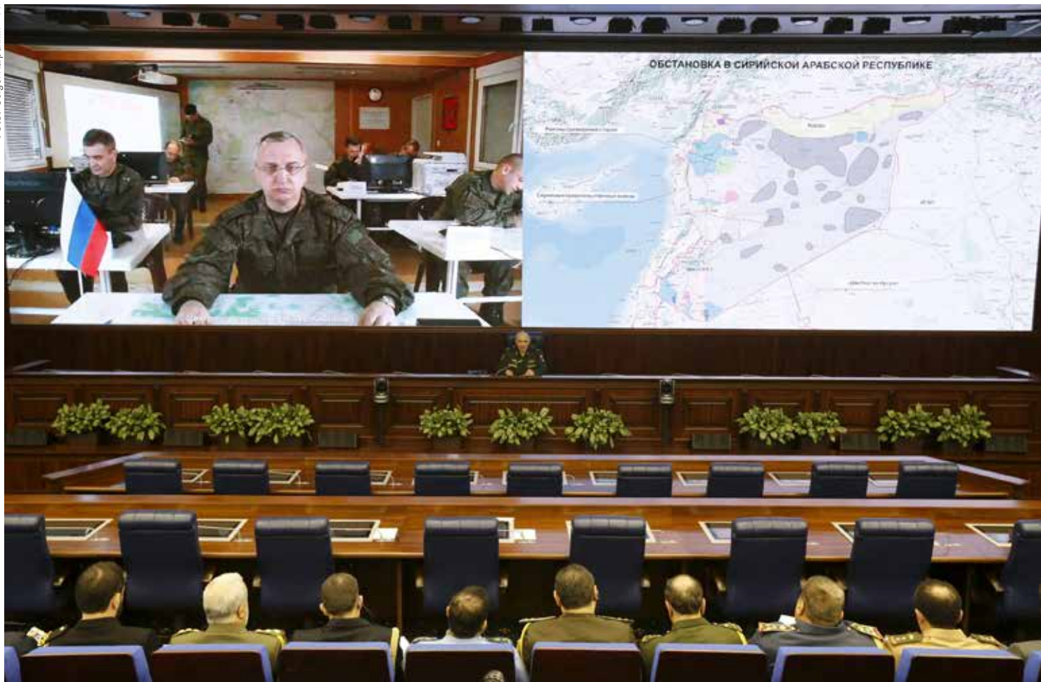
I sin nationella strategi anklagar Ryssland Väst för dubbelmoral, bland annat i Mellanöstern.

I DEN REVIDERADE NATIONELLA säkerhetsstrategin 2015 tecknas en bild av ett allt starkare Ryssland där de "traditionella ryska andliga och moraliska värderingarna har förstärkts." Utvecklingen i världen är instabil, och Rysslands självständiga utrikes- och inrikespolitik har lett till att USA och dess allierade utsätter Ryssland för tryck – politiskt, ekonomiskt, militärt och informationsmässigt. Därtill påstås att Västs målsättning att förhindra integrationsprocessen i Eurasien inverkar negativt på Rysslands nationella intressen. I denna allt instabilare omvärld förvärras, enligt dokumentet, läget också av att "vissa länder använder informations- och kommunikationsteknologier för att nå sina geopolitiska mål, till exempel manipulering av den allmänna opinionen och falsifiering av historien.