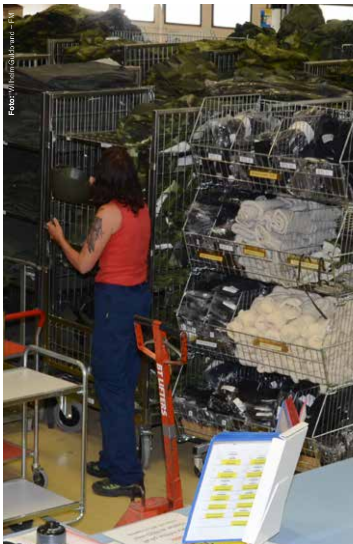
En lång rad åtgärder har inte gett önskad effekt vilket leder till problem.