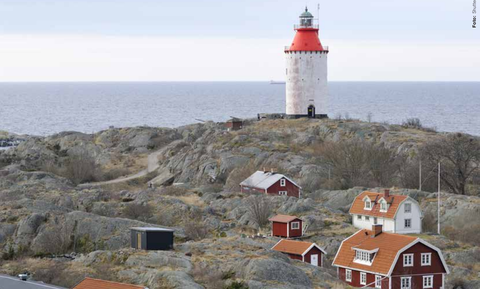
En talare menade att vi måste börja våga diskutera vilka delar av Sverige som inte ska försvaras. Bild från Landsort

mänheten vill att finska försvaret ska samarbeta med Sverige. Bara 27 procent vill att vi ska gå med i Nato.