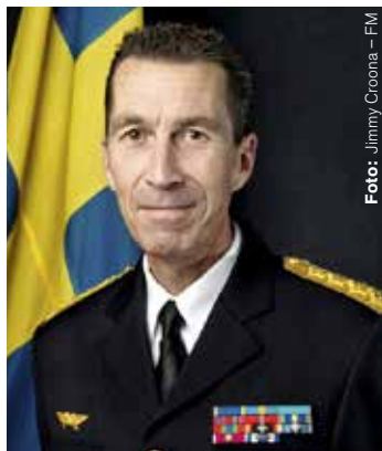
ÖB Micael Bydén

Parallellt med detta är budgetunderlaget fullt med varningar: "Försvarmakten konstaterar dock