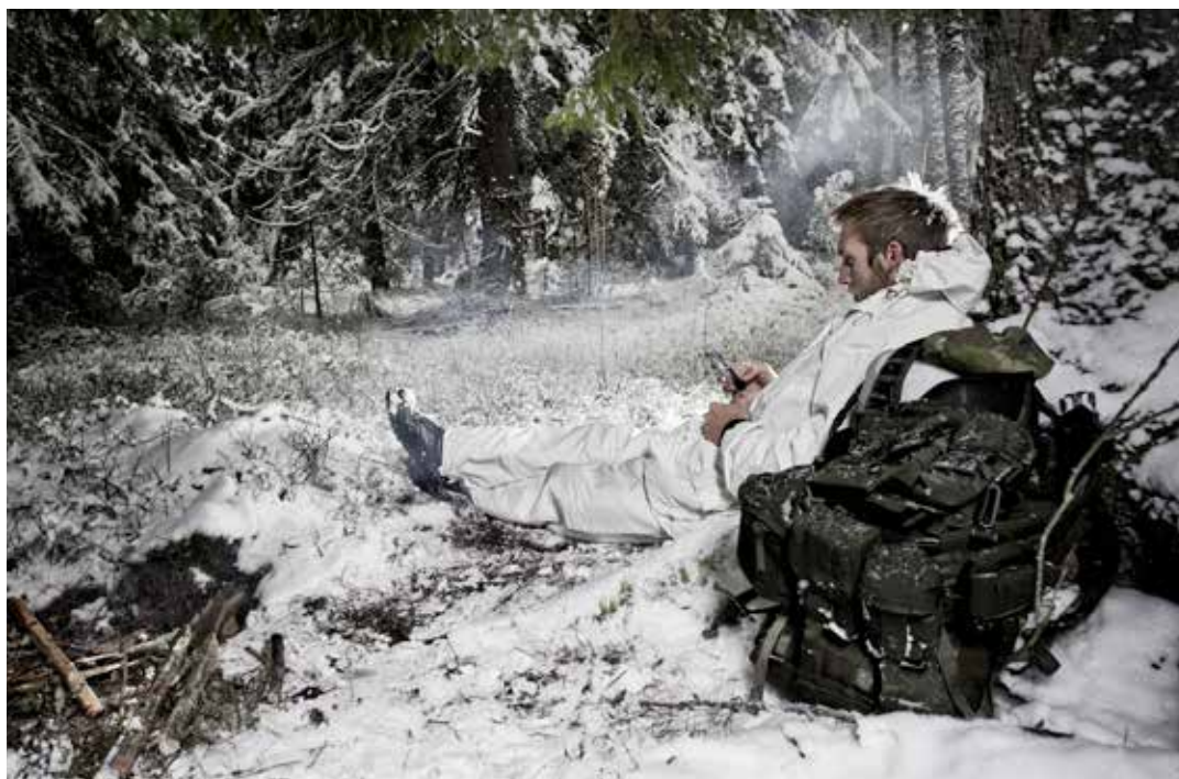
Försvarmaktens prognos från i höstas visade sig stämma. Var femte soldat sade upp sig.

– Vi måste förstå själva vad som sker bakom siffrorna och kunna