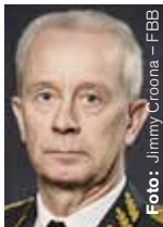
ÖB Sverker Göransson

Den artonde januari rapporterade Försvarmakten att ÖB Sverker Göransson sjukskrivits i två veckor på grund av arbetsutmattnings.