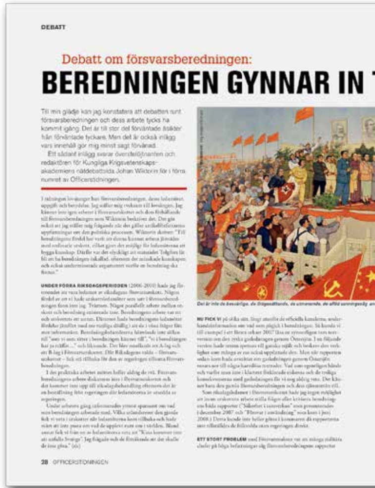
Ur Officerstidningen nummer 9 2012.

DET FINNS ETT konstitutionellt problem med Försvarsberedningen, och det är att den är ett organ med uppdrag från regeringen. Det går att anamma olika perspektiv på det problemet. Det ena är att det undanröjer riksdagens makt och inflytande, vilket formellt sett är riktigt. Å andra sidan finns det möjligheter för riksdagens partier att tidigt påverka skrivningarna i regeringens propositioner som kommer efter bland annat beredningens rapporter. Just