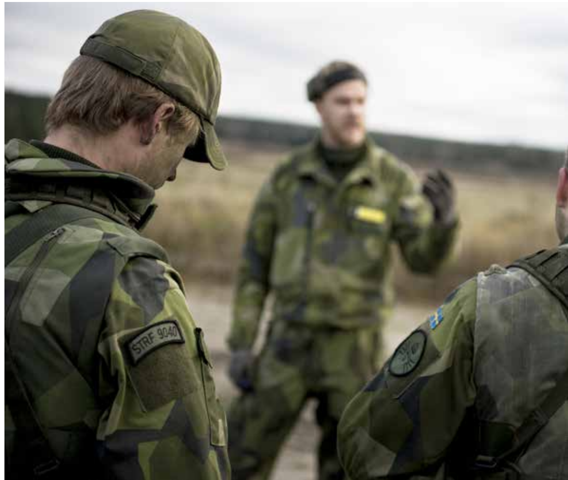
Brist på tid, pengar och personal gör att kompanichefer larmar om minskad förmåga till strid i kompanis ram.

Markstridsskolan utvecklar nu kortare kurser där taktik och befälsföring kan tränas. Det handlar