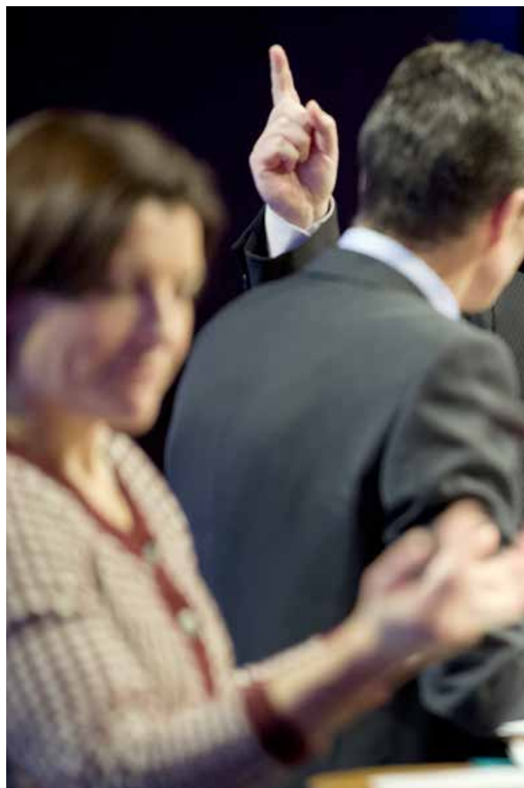
Försvarsminister Karin Enström, Natos generalsekreterare Anders Fogh-Rasmussen

Han välkomnade Sverige som medlem i Nato och lovade en snabb process vid eventuell medlemsansökan. Den som hoppas kunna använda en eventuell Natodiskussion som hävstång för