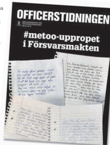
I Officerstidningen nr 8/2017 publicerades vittnesmål och berättelser från kvinnor som upplevt trakasserier och kränkningar i Försvarsmakten.