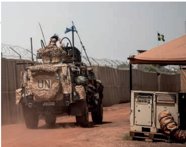
Under april inträffade två attacker mot FN-campen i Timbuktu.