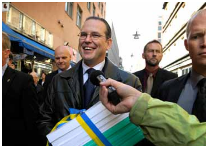
Regeringen förväntar sig lika mycket effekt för mindre pengar.

Officersförbundet är klivet till nedläggningen av fortifikationsverket.