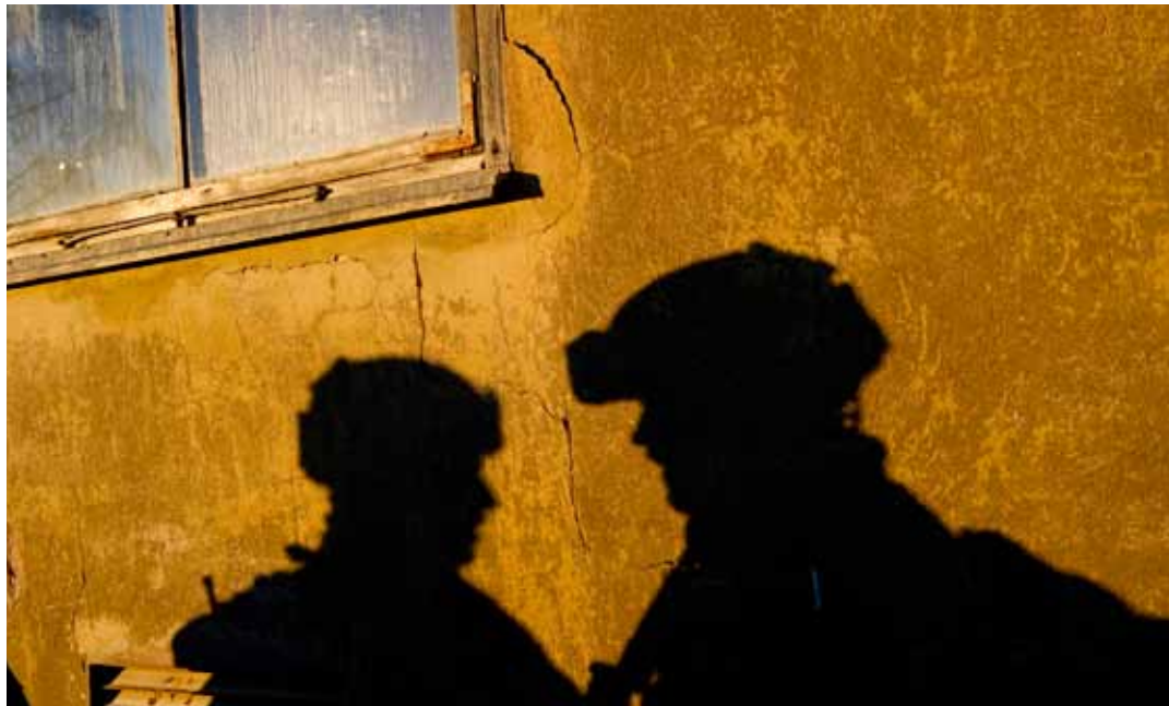
Soldater med erfarenhet från Afghanistan i kombination med frånvarande befäl gav uppluckrade säkerhetsrutiner.

Frånvaron av plutonchefer gav soldater och gruppchefer stort svängrum. Några av dem hade tidigare deltagit i internationella insatser och ansåg sig så erfarna att de kunde bortse från rutiner, checklistor och regler.