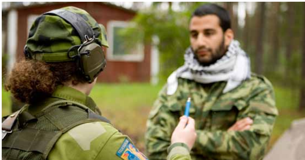
Försvarsmakten jagar tidigare värnpliktiga för att hitta deltidsanställda gruppchefer, soldater och sjömän.

Högkvarterets budskap till förbanden är att rekrytering ska