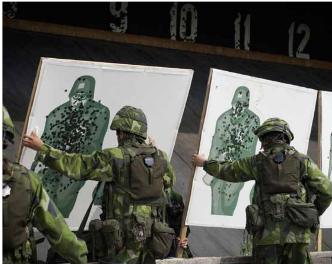
Flera förband befärrar sänkt servicenivå på skjutfält och skjutbanor med den föreslagna basorganisationen.

– Vi på F7 uppfattade under våren att vi inte fick gehör för våra synpunkter. Men i förra veckan