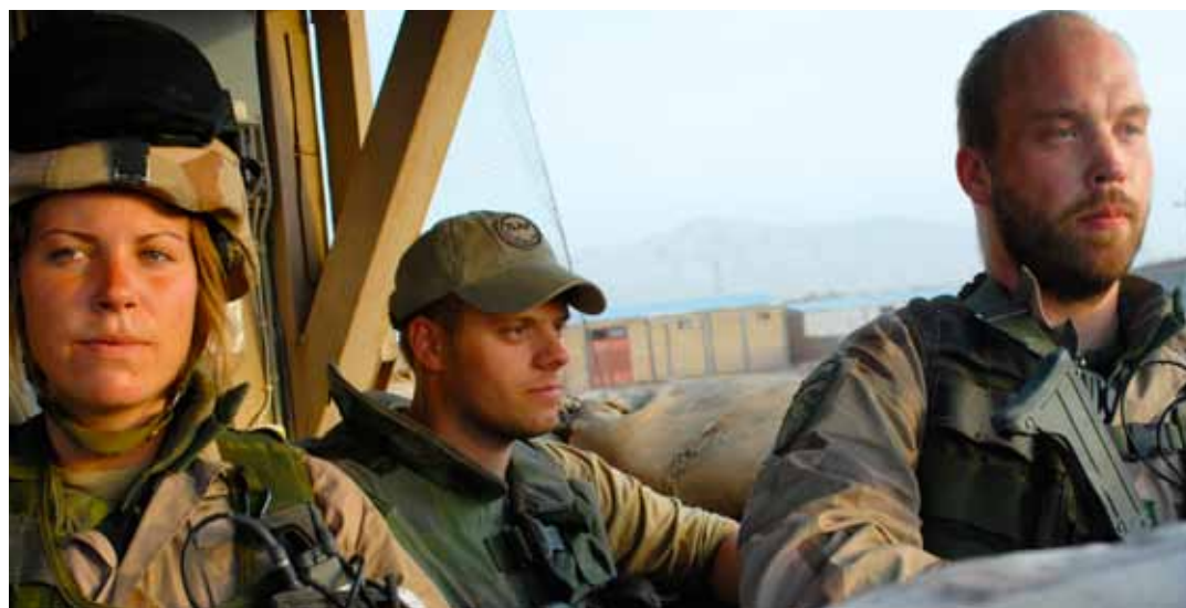
56 procent av Försvarsmaktens gruppchefer, soldater och sjömän är medlemmar i Officersförbundet.