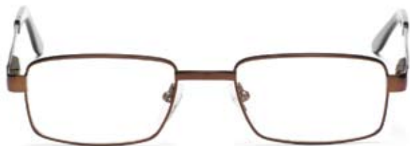
Bågmodell LEIF C1

Militär, Journalist, Psykolog, Brandman, Snickare eller Sjuksköterska