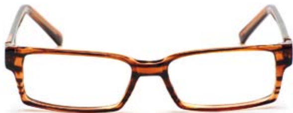
Bågmodell UNO C2

Som hjälp på traven för den engagerade genomför Officersförbundet årligen minst en kurs om arbetsmiljöfrågor.