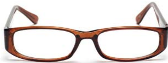
Bågmodell ROBYN C2

Kirurg, Advokat, Förskollärare, Pilot eller Snabbköpskassör