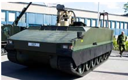
SEP – fordonet i fokus för debatten.

Minor är enligt internationella studier det största hotet mot denna typ av fordon. Det, av BAE Hägglunds tillsammans med FMV under en 15-årig utvecklingsperiod, framtagna fordonet SEP är avseende skyddet mot minor helt överlägset det finska fordonet Patria.