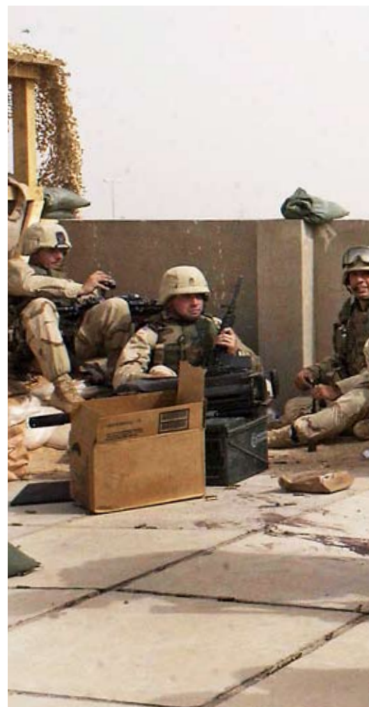
Blackwateranställda i civila kläder deltar i en eldstrid i