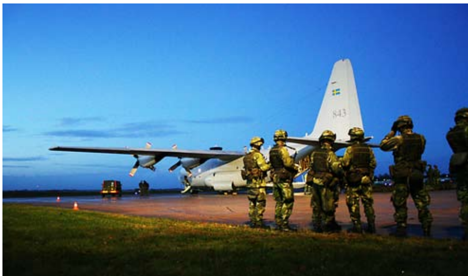
Sju löjtnanter från Helikopterflottiljen och F17 har vägrat teckna nya avtal om obligatorisk utlandstjänst innan villkoren är definierade.

– Jag tror inte att arbetsgivaren kommer att skicka ut mig två år i sträck, men det viktiga