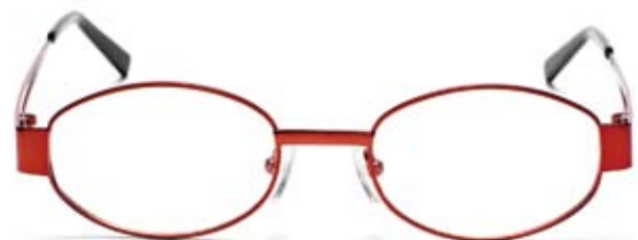
Bågmodell STINA C4

It-konsult, Byggnadsingenjör, Idol, Lärare eller EI-montör