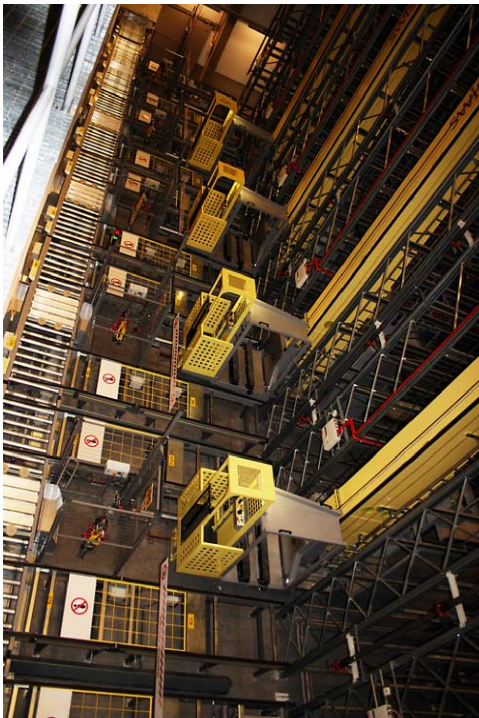
Det nya centrallagret är gigantiskt och ska kunna hantera stora flöden av materiel.

Försvarmaktens Centrallager är en del av Försvarmaktens nya försörjningskoncept för förnödenheter och kommer att ersätta en rad serviceförråd runt om i landet. Antalet serviceförråd ska minskas. Istället införs ett antal så kallade servicecenter med 30–40 anställda och så kallade servicepunkter med 1–6 anställda. Det kommer att finnas 18 servicecenter och 12 servicepunkter.