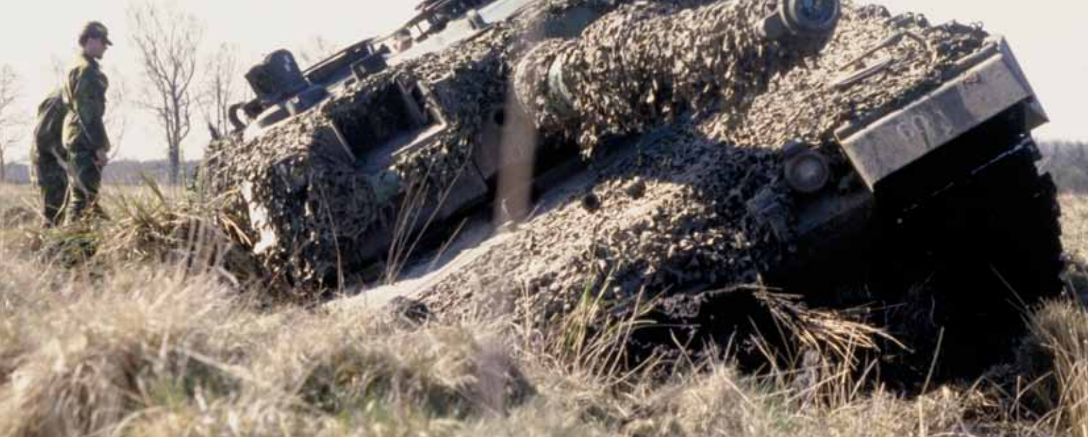
Sammantaget ger olycksrapporterna en bild av en organisation i behov av skärpta rutiner, anser Statens Haverikommission.