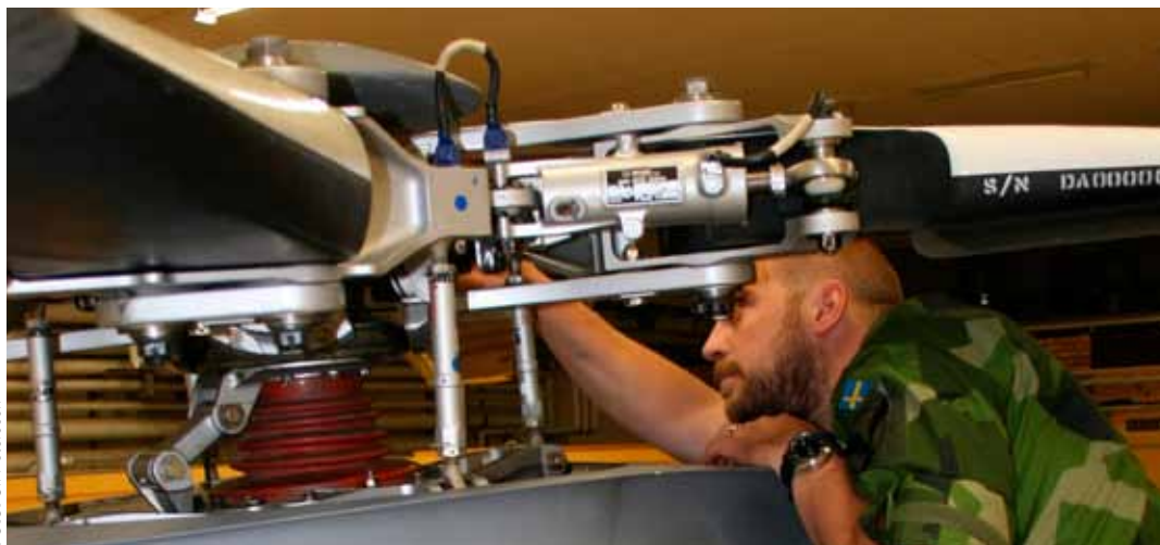
Bristen på flygtekniker har gått från stor till alarmerande.