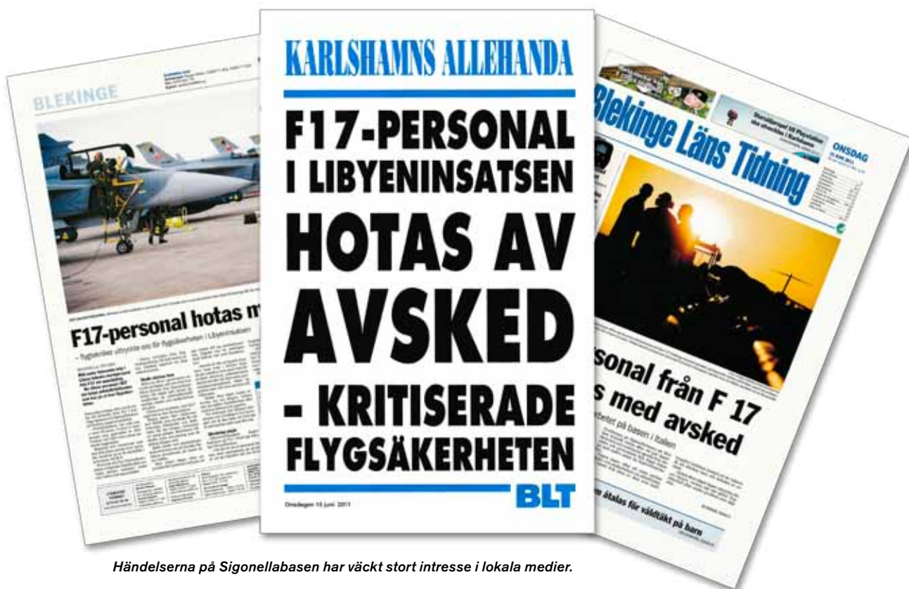
Händelserna på Sigonellabasen har väckt stort intresse i lokala medier.