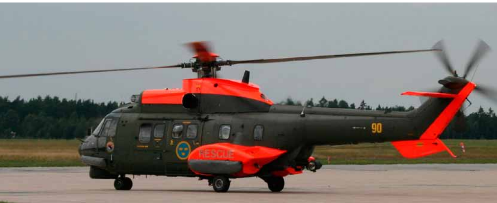
Startklar HKP 10, Superpuma.