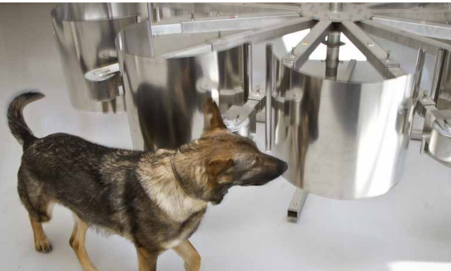
Schäferhund Duni hittar rätt behållare varje gång.