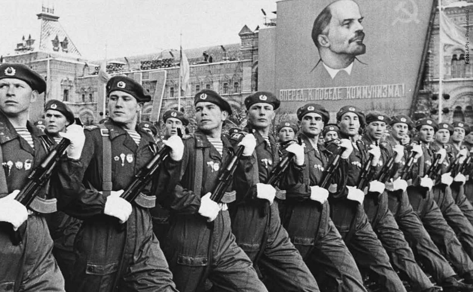
Rysslands politiska och militära ledning vill omvandla de väpnade styrkorna.

mobiler för att nå underställda förband och positioneringssystemet som Ryssland försökt få operativt sedan många år, GLONASS, kunde knappt användas alls. Inte heller tycktes ryska styrkor kunna agera samordnat. Trots de åtgärder som tidigare vidtagits måste flyg och armé ledas från Moskva, vilket ledde till missöden och tidsförluster i operationerna.