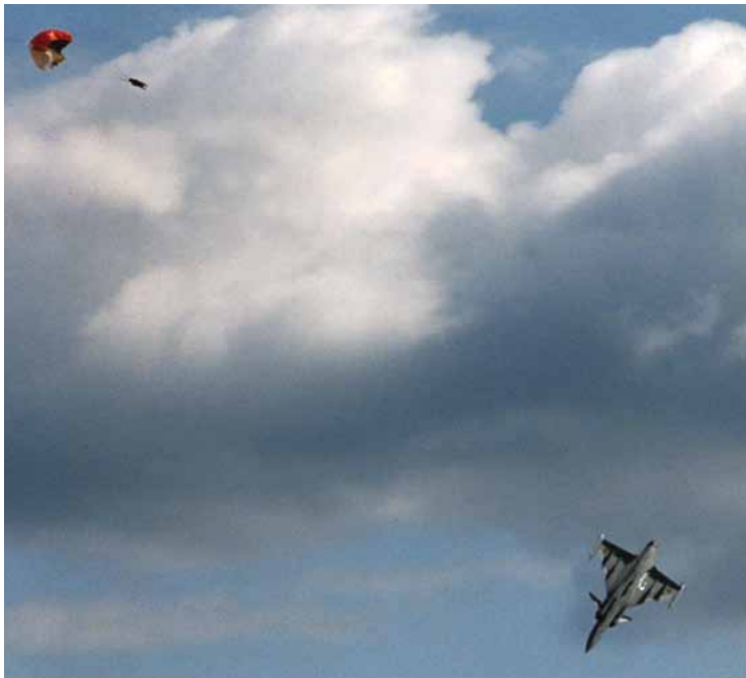
Sammanlagt hittades 18 felpackade räddningskärmar till JAS Gripen. Bilden är från Vattenfestivalen, augusti 1993.

Efter det inträffade påbörjades ett intensivt arbete med att identifiera fler felaktigt monterade fallskärmar. De flygplan som dagen efter skulle iväg för att delta vid insatsen i Libyen snabbinspekterades och konstaterades ha korrekt monterade fallskärmar. Sammanlagt hittades 18 felpackade skärmar, de flesta monterade i Gripen-flygplan.