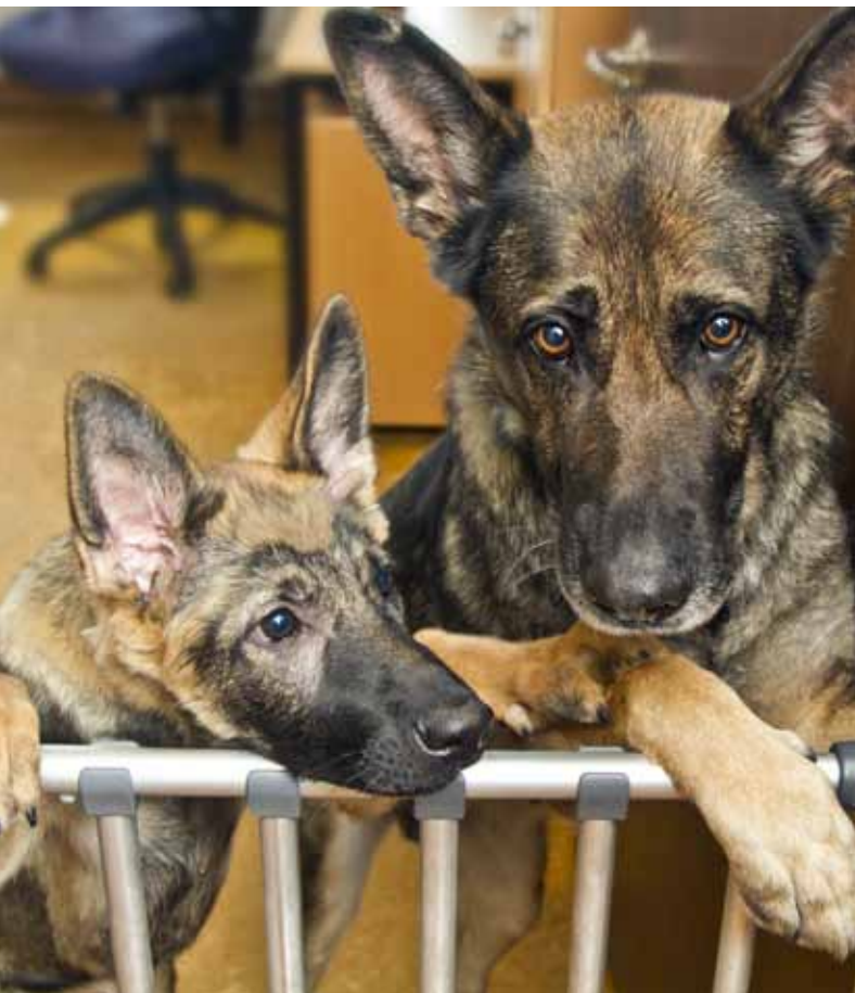
35–50 hundvalpar kommer årligen till hundskolan.

hundens sociala förmåga, psyke, mod och om den har det driv och intresse som kännetecknar en bra hund. En och samma person gör alla lämplighetstester för att bedömningen ska bli så enhetlig som möjligt. Lämplighetstestet är det första av ett antal kontrollstationer där hundens färdigheter undersöks.