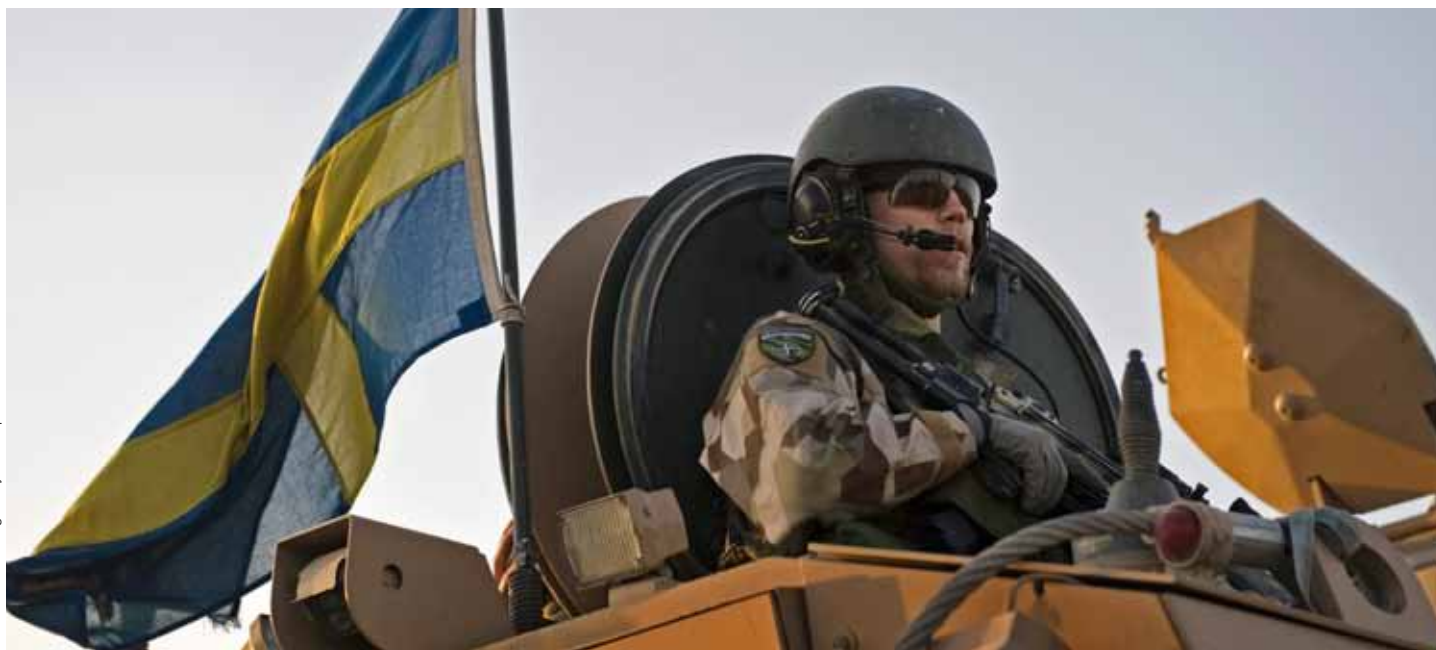
Försvarsmakten sa upp 116 officerare som tackat nej till ändrad arbetsskyldighet. Av dessa beslutade sju att tillsammans med Officersförbundet driva frågan vidare. Nu tas ärendet upp i Arbetsdomstolen för en rättslig prövning.