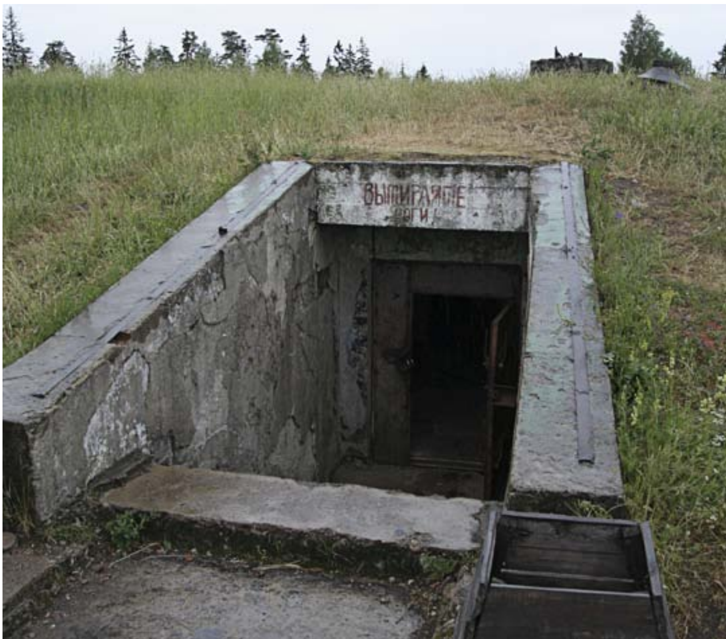
Huvudingången till missilbasen i Plokstine.