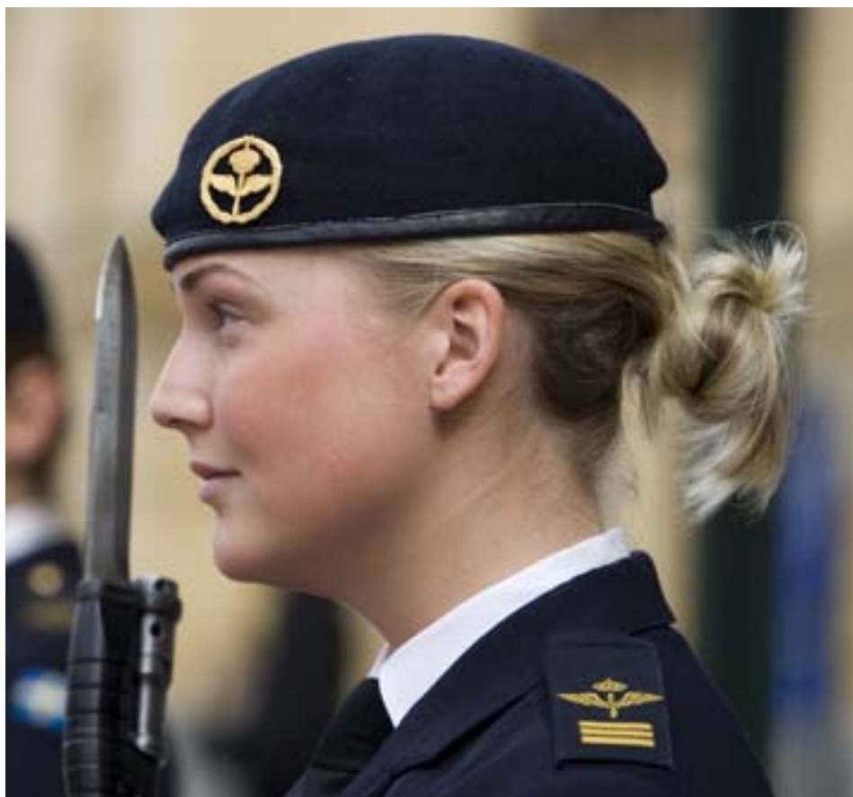
30 år efter att de första kvinnliga värnpliktiga ryckte in utgör jargong och utrustning ännu hinder.

– Varje gång man går in i en ny grupp ska det testas. Oftast går det bra, men inte alltid. Som tjej är det extra viktigt att sätta tydliga