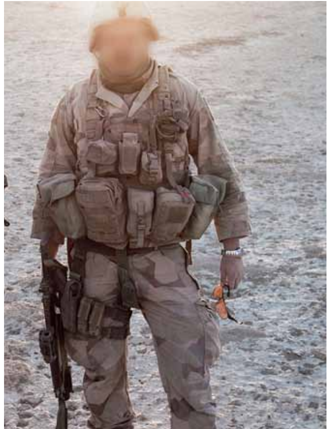
En icke godkänd stridsväst av modell Blackhawk Chestrig.