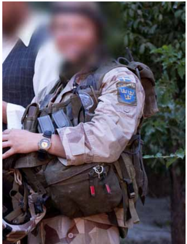
Soldat utrustad enligt regelverket med Stridsväst 2000.