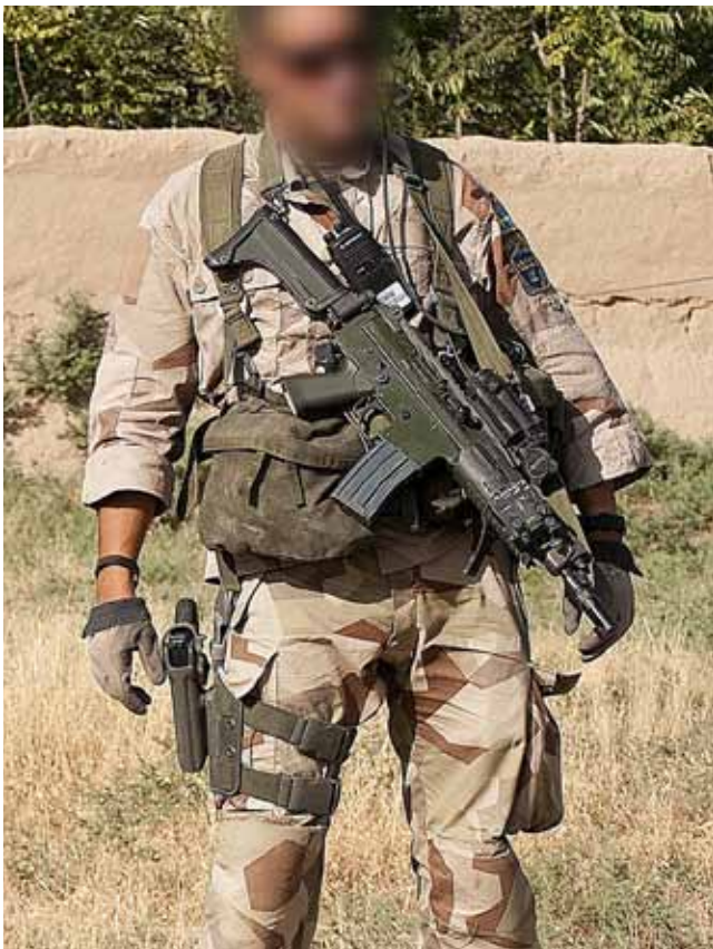
Soldat med en modifierad stridssele av äldre modell.