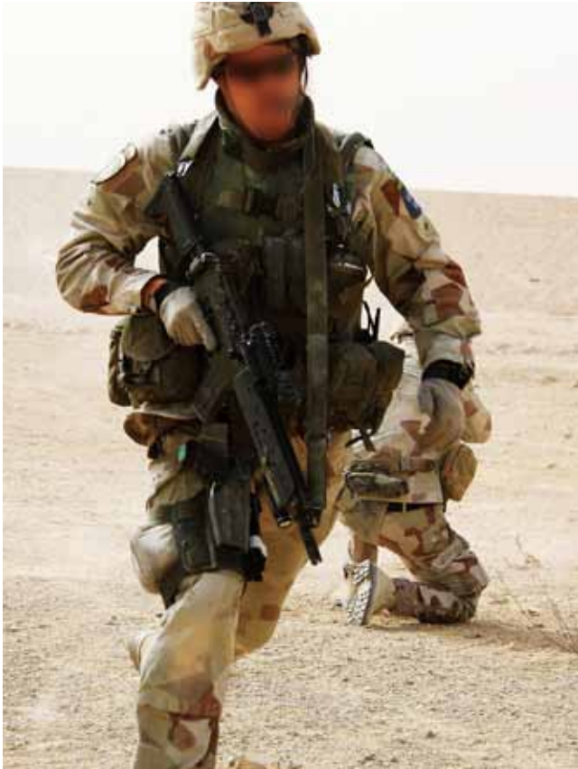
En variant där en äldre typ av stridssele som modifierats används.