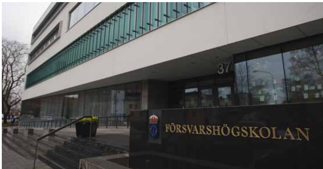
Inget fusk, men bristande redovisningsrutiner på Förvarshögskolan, visar en utredning.