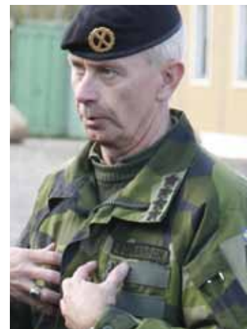
ÖB Sverker Göranson.