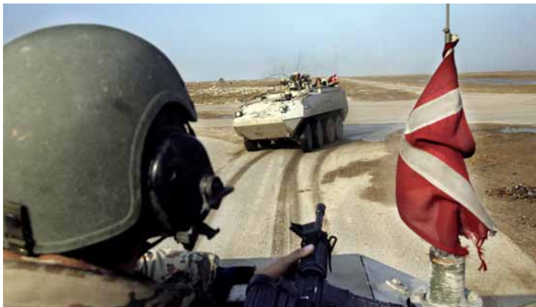
Dansk domstol vill tvinga psykolog att vittna mot soldater.