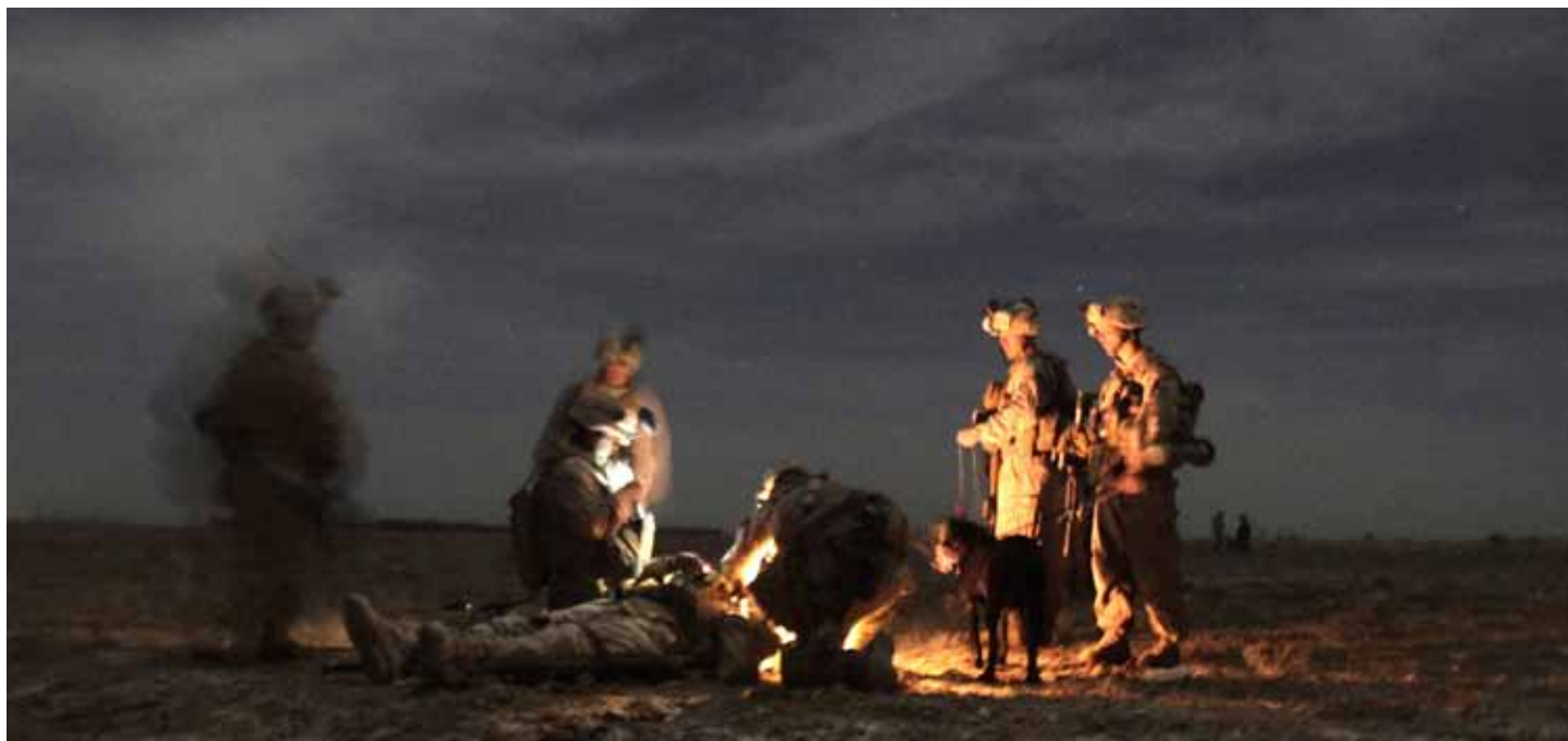
Amerikanska soldater ger första hjälpen efter en IED-attack i Afghanistan.