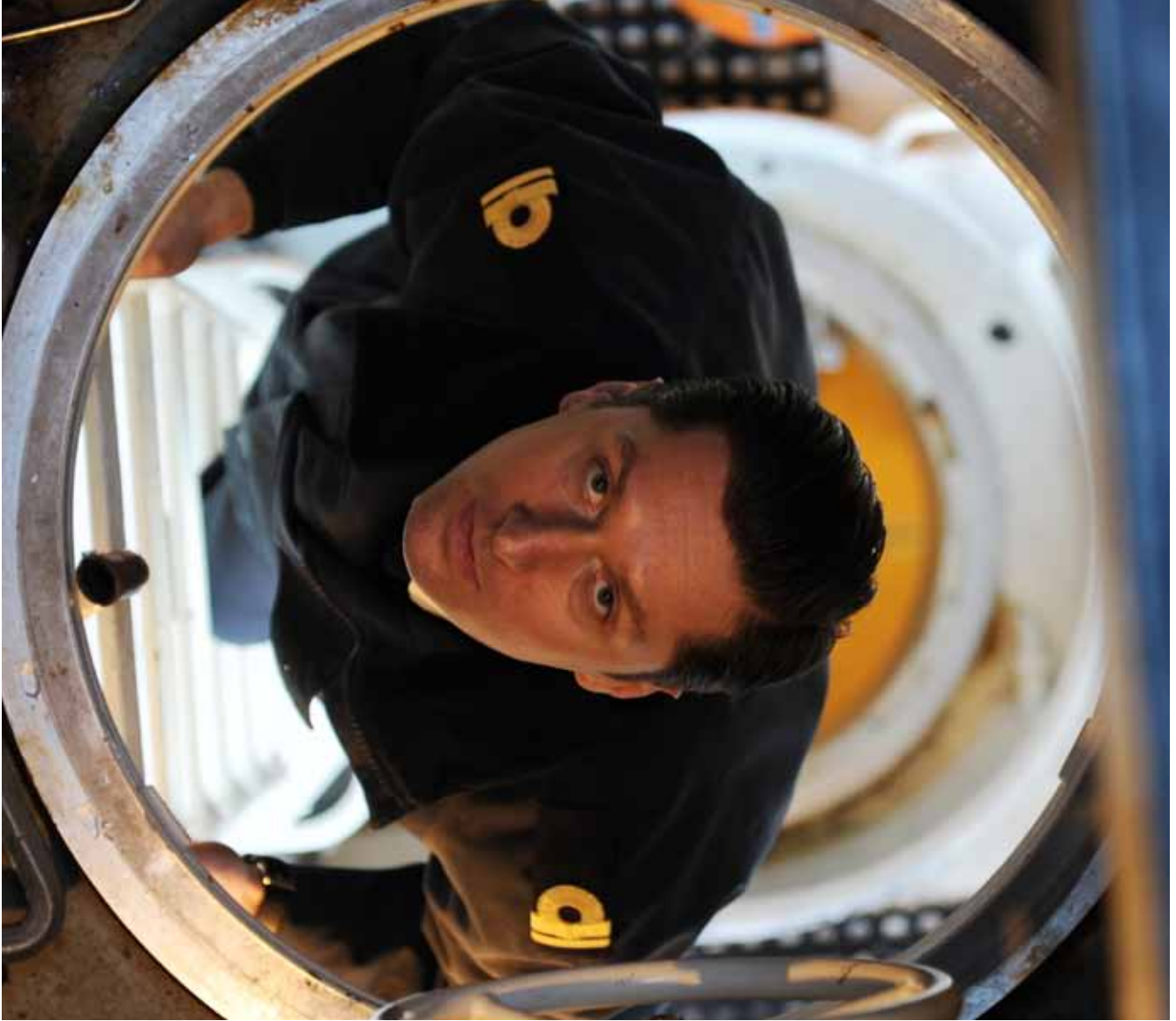
En incident i u-läge kan snabbt få förödande konsekvenser och man strävar hela tiden efter att minimera riskerna.

Säkerhetstänkandet ombord är högt. En incident i u-läge kan snabbt få förödande konsekvenser och man strävar hela tiden efter att minimera riskerna. Syrehalten ombord är relativt låg och ligger runt 18 procent istället för det normala 21 procent. Därmed räcker syreresserverna längre samtidigt som brandrisken minskar. Koldioxiden från utandningsluften suggs upp med hjälp av kalk och samtliga utrymmen ombord är bemannade dygnet runt.