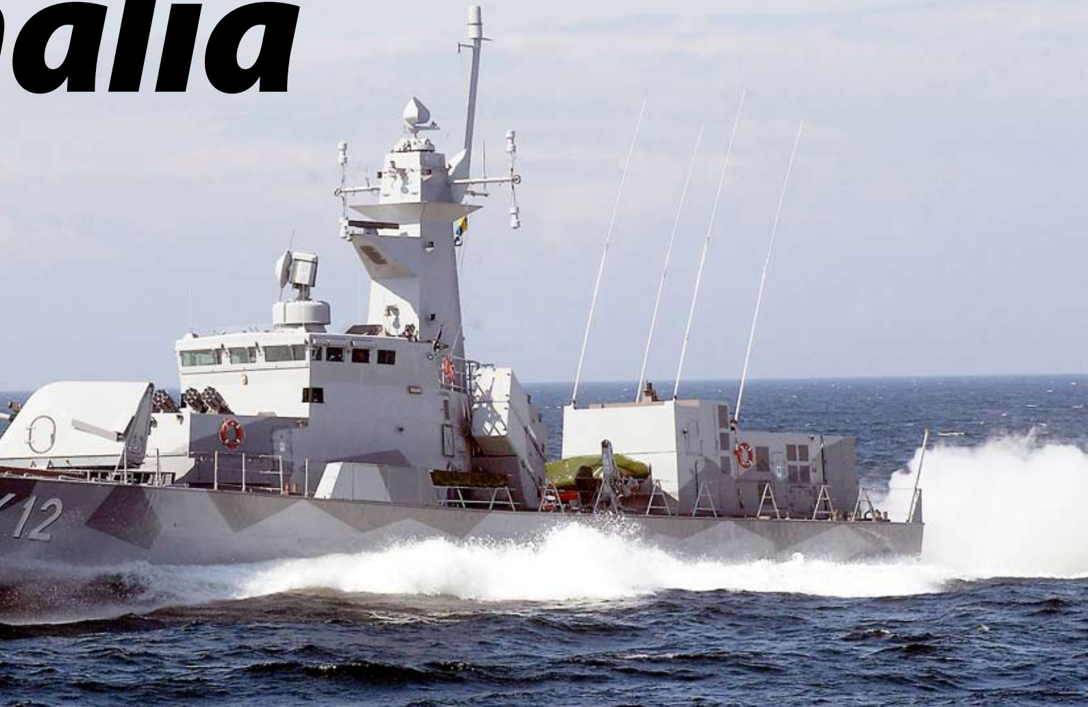
svensk insats i vattnen utanför Somalia.