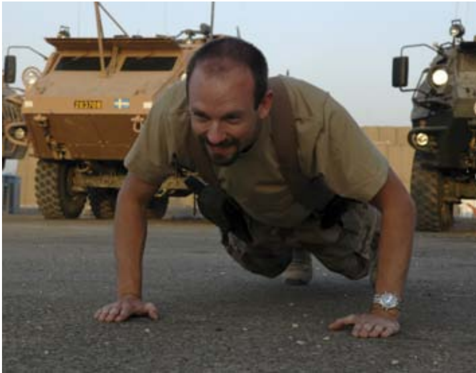
Antalet aktiva medlemmar i förbundet har ökat med 615 på ett år.