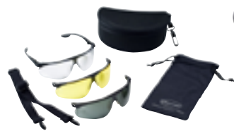
3M™ Maxim Ballistic TacPack

För mer information, välkommen att kontakta vår Kundtjänst på telefon 0370-65 65 00. Referera till ramavtal FM479-U051406 vid beställning