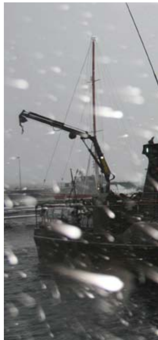
De tre officerarna och de fem värnpliktiga ombord

Strax efter förtöjningen börjar kocken laga mat nere i bevakningsbåtens trånga innandöme. På ena sidan av båtens mittkorridor ligger köket – eller byssan som det kallas till sjöss – och en hytt med plats för två. På den andra sidan ligger officerarnas mäss, ytterligare en hytt med två sängplatser, samt