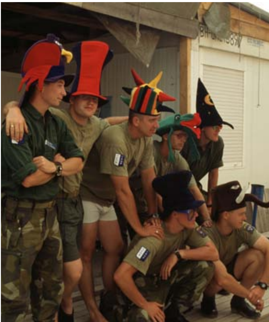
Hatt i Prio ger makt menar insändarskribenten.