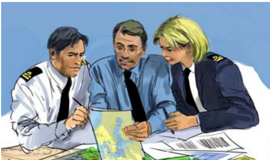
Illustration: Wolfgang Bartsch - Forsvarets Bildbyrå

Ny utredning föreslår regionala staber ute i landet och sammanslagna staber på Högkvarteret.