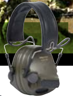
Peltor™ ComTac™ XP